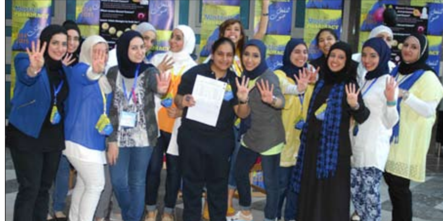
طالبات قائمة المستقلة يعبرن عن فرجهن بالفوز