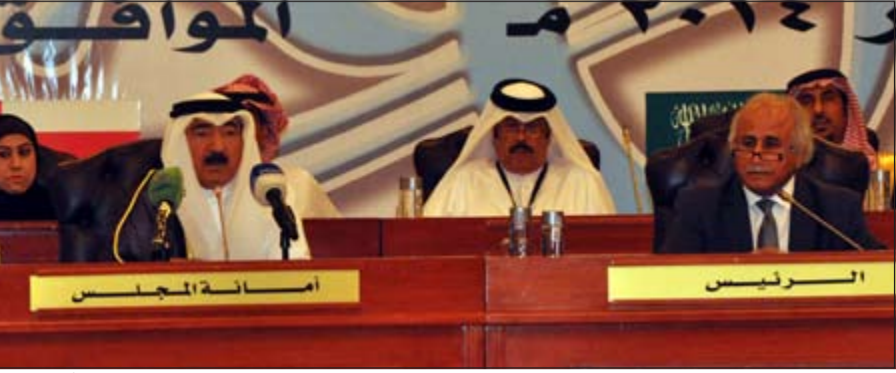
د.عبدالله العليان في افتتاح الاجتماع العشرين للجنة رؤساء ومديري الجامعات الخليجية

أكد رئيس جامعة الكويت د.عبدالله العليان أن مستقبل أهداف جامعات الخليج واحدة وهي تعليم شعبنا بالنوعية والجودة العالية، مشيراً إلى أن الهدف الأساسي الذي تسعى إليه جامعاتنا هو التطوير وتحسين التنوع المعرفي والمعلوماتي، جاء ذلك خلال الاجتماع العشرين للجنة رؤساء ومديري الجامعات ومؤسسات التعليم العالي في دول مجلس التعاون الخليجي والذي تستضيفه جامعة الكويت دورته الحالية خلال الفترة من 13 إلى 15 الجاري وبحضور الأمين العام المساعد لشؤون الإنسان والبيئة في الأمانة العامة لمجلس التعاون لدول الخليج العربية د.عبدالله الهاشم ورؤساء الجامعات والمؤسسات التعليمية في الخليج. وقال إن جامعاتنا بدأت منذ عدة سنوات لتحقيق هذا الهدف إلا أن جامعة الملك سعود بدأت كأول جامعة في الخليج العربي في العام 1957، ومنذ ذلك الوقت وهي تتطور وتحرس على الاعتماد الأكاديمي بجهود القائمين عليها، مضيفاً أن الوكلاء ناقشوا عدة مواضيع مهمة لمجتمعنا ولجامعاتنا من خلال اللجان الفنية التي ناقشتها وأقرتها ومهمتها اليوم