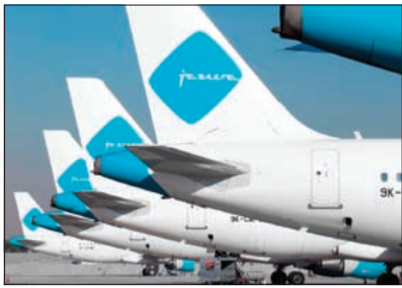
ارتفاع عدد المسافرين على 12 خطاً من الخطوط التي تخدمها الجزيرة

واستحوذت «طيران الجزيرة» على حصة تشغيلية بلغت 14% على الخط الذي يخدم دبي، وعلى حصة تشغيلية بلغت 10% على الخط الذي يخدم البحرين، وعلى حصة تشغيلية بلغت 22% على الخط الذي يخدم جدة، وعلى حصة تشغيلية بلغت 12% على الخط الذي يخدم الرياض.