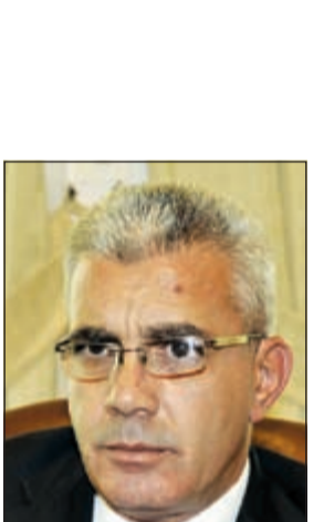
السفير رامي طهوب

من جهة أخرى، رحب طهوب بما ورد صباح الخميس الماضي في بعض وسائل الإعلام الكويتية حول مسعى عدد من النواب الكويتيين لإيجاد الآلية القانونية للسماح للمواطنين الكويتيين بزيارة المسجد الأقصى المبارك. وقال إن مثل هذا الإعلان يأتي في توقيت هو الأكثر إلحاحا وحاجة للالتفاف حول المسجد الأقصى المبارك ومدينة القدس في ظل حملة شرسة غير مسبوقة يقوم بها الاحتلال الإسرائيلي لفرص كامل سيطرته على المسجد الأقصى وإنهاء الوجود العربي الإسلامي فيه.