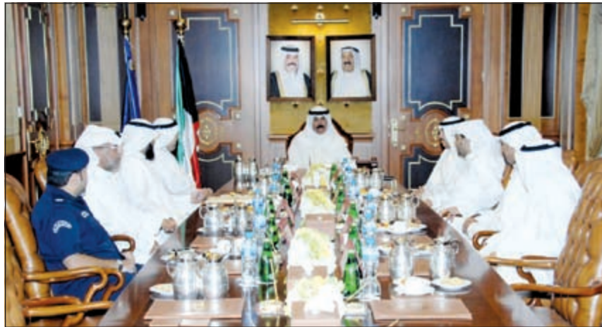
الشيخ محمد الخالد خلال لقائه رئيس وأعضاء بعثة الحج الكويتية

بدوره أوضح الفلاح أن توجيهات الشيخ محمد الخالد وملاحظاته للبعثة خلال اجتماعه بهم قبل السفر إلى السعودية بشأن التعاون مع السلطات السعودية وضرورة توعية وإرشاد جميع حملات الحج الكويتية بالوسائل الآمنة والسلامة وحثهم على السلوك الحضاري والابتعاد عن كل ما يعكر صفو هذه الفريضة المقدسة كانت خير مرشد لهم ومعين وساهمت في إنجاح عمل اللجنة والتطلع لتميزها.