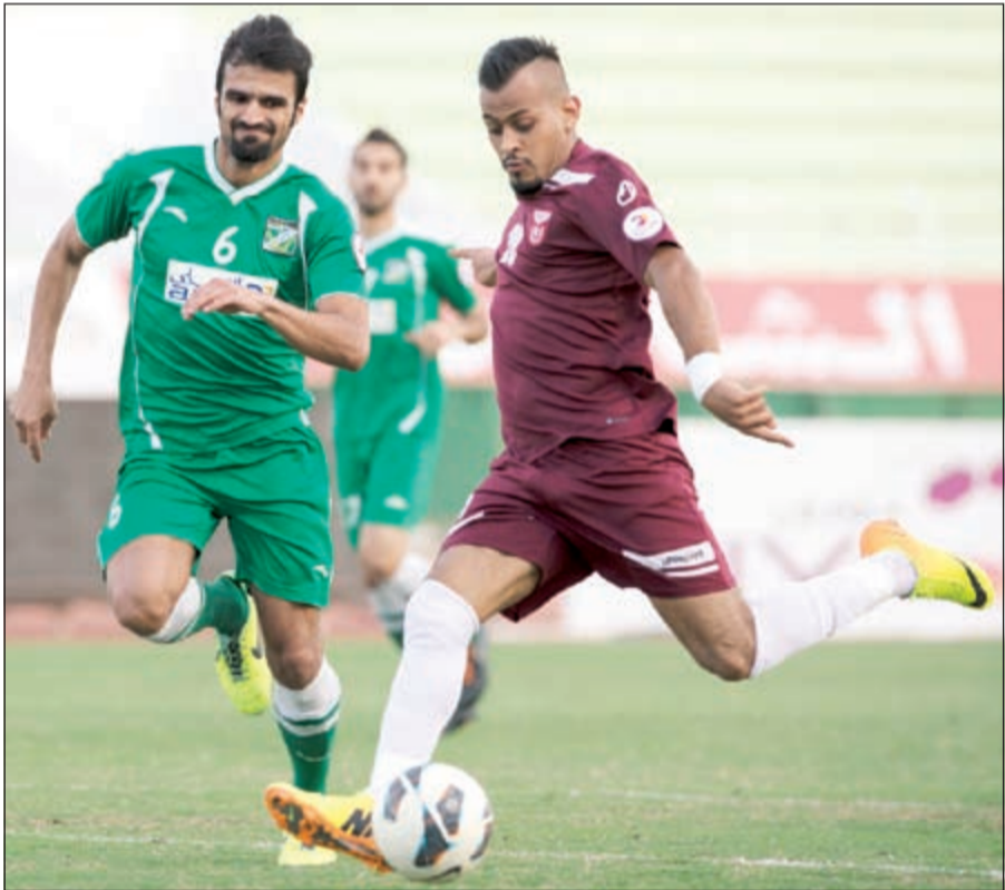
النصر يطلب تخفيف أو إلغاء عقوبة باني (الأزرق.كوم)