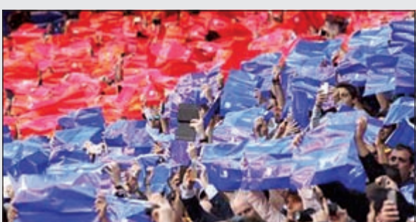
لسان حال الفرنسيين.. لا يزيد برشلونة

وكان قد أعلن في وقت سابق عن إمكانية التحاق برشلونة بالدوري الفرنسي في حال انفصال إقليم كاتالونيا عن إسبانيا. متصدراً للديفا حالياً لا يمكن أن يلعب في الدوري الإسباني فريق من خارج إسبانيا. والآن البرسا يواجه المجهول في حال انفصلت كاتالونيا وأصدر الاتحاد الفرنسي لكرة القدم رفضاً رسمياً بعد هذا البيان.