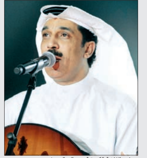
سفير الأغنية الكويتية، عبدالله الرويشد

المقبل واجتماع وكلاء الثقافة الخليجيين في اليوم الذي يليه، بنظم المجلس الوطني للثقافة والفنون والآداب حفلا غنائيا الخميس المقبل لتدشين افتتاح مسرح السالمية التابع