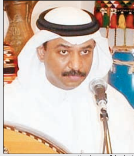
أخطبوط العود، عبادي الجوهر