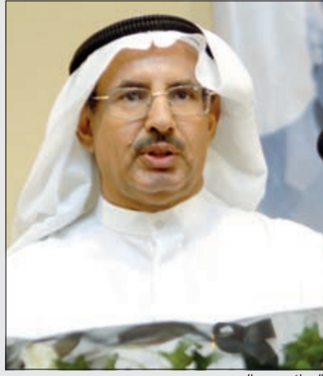
الروائي حمد الحمد