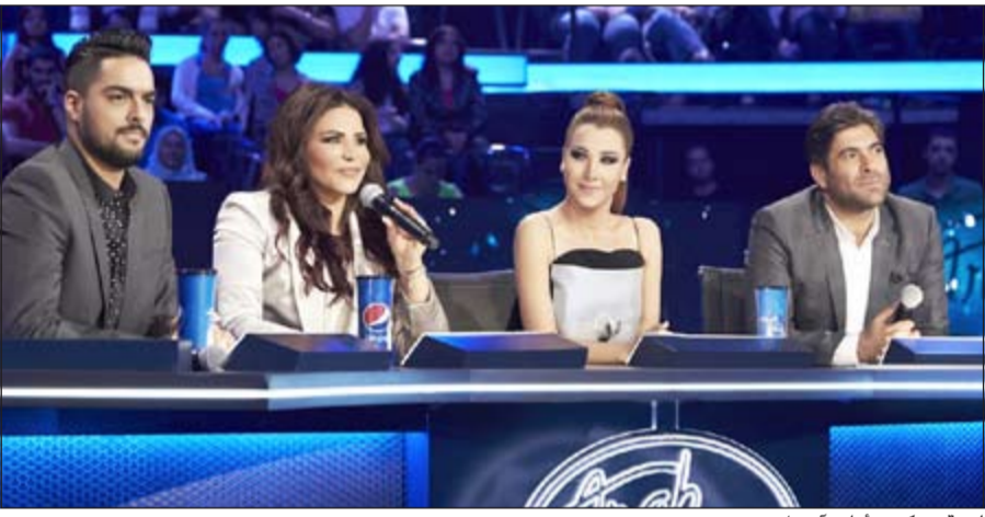
لجنة تحكيم «أراب آيدول»