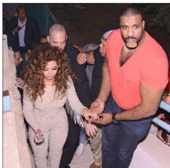
ميريام وبجوارها حارسها الشخصي

وتأقت ميريام في الحفل، حيث قدمت مجموعة كبيرة من أغنياتها الشهيرة منها «ناديني»، و«هلق راحتك»، و«أنا والشوق»، و«أنا قلبي ليك»، و«واحشني إيه»، و«أنا مش أنانية»، و«حسستي بيك»، و«يا عالم بالحال»، وركزت على هذه الأغنيات وسط تفاعل الجمهور معها، كما قدمت أغنية «سواح» للعنديل الأسمر عبدالحليم حافظ، و«يا بنت السلطان» للمطرب الشعبي أحمد عدوية. يذكر أن النجمة اللبنانية أعلنت عن زواجها مؤخرا من رجل الأعمال اللبناني داني متري بشكل مفاجئ وبدون تفاصيل وقضت شهر العسل في إحدى الجزر اليونانية.