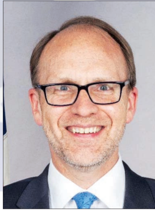
السفير الأميركي دوغلاس سيليمان

أحد أكثر الجوانب الممتعة والمثيرة في عملي كسفير للولايات المتحدة في الكويت هو مساعدة المواطنين الكويتيين في استكشاف عوالم جديدة وشيقة في الثقافة الأميركية. وأنطلاقاً من التزامي بإحضار أفضل ما في الولايات المتحدة الأميركية إلى الكويت، أعلن وبكل سرور عن إطلاق مهرجان «اكتشف أميركا» للاحتفال بالثقافة الأميركية وما تشمله من ترفيه وتعليم وتسوق والمطبخ الأميركي على مدار أسبوع. سيتمثل هذا المهرجان فعاليات تأسر الخيال وتشعل الحواس، تشمل عروضاً سينمائية وموسيقية بالإضافة إلى المعارض التعليمية والغذائية التي تمكنكم من استكشاف عمق وتنوع التجربة الثقافية الأميركية. وستقام الفعاليات في مجمعات ومراكز التسوق المختلفة في أرجاء الكويت. نهدف من خلال مهرجان «اكتشف أميركا» توفير فرصة للاستمتاع بجوانب من الحياة الأميركية لجميع