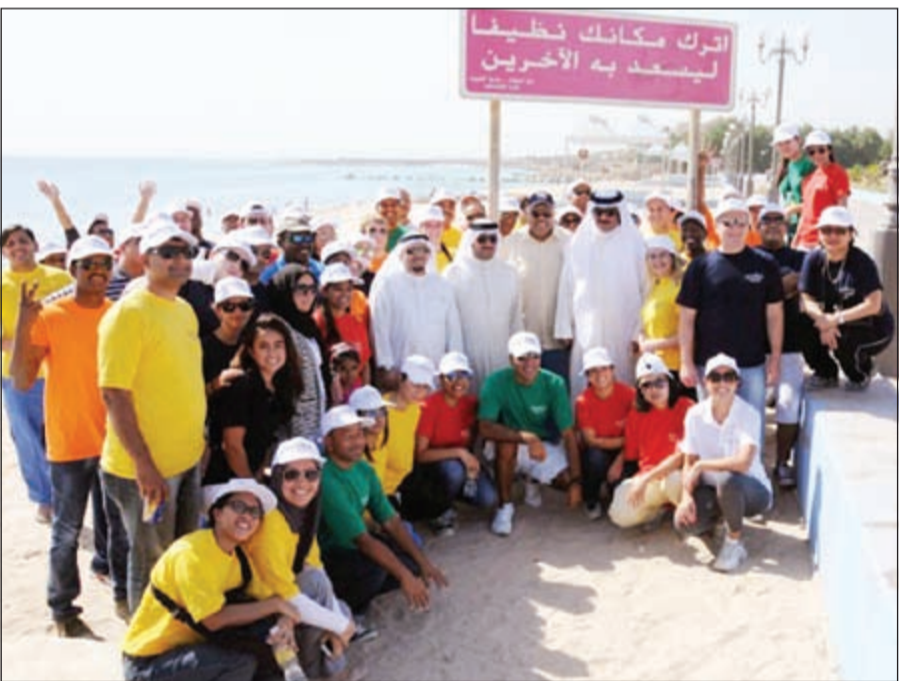
موظفو الفندق خلال حملة التنظيف

لمسافة 200 متر، وبركتي سباحة ومنطقة مخصصة للعب الأطفال. إضافة إلى مرافق واسعة لاستضافة المؤتمرات والاحتفالات، أهمها صالة زفاف تمتد على مساحة 1950 مترا مربعا.