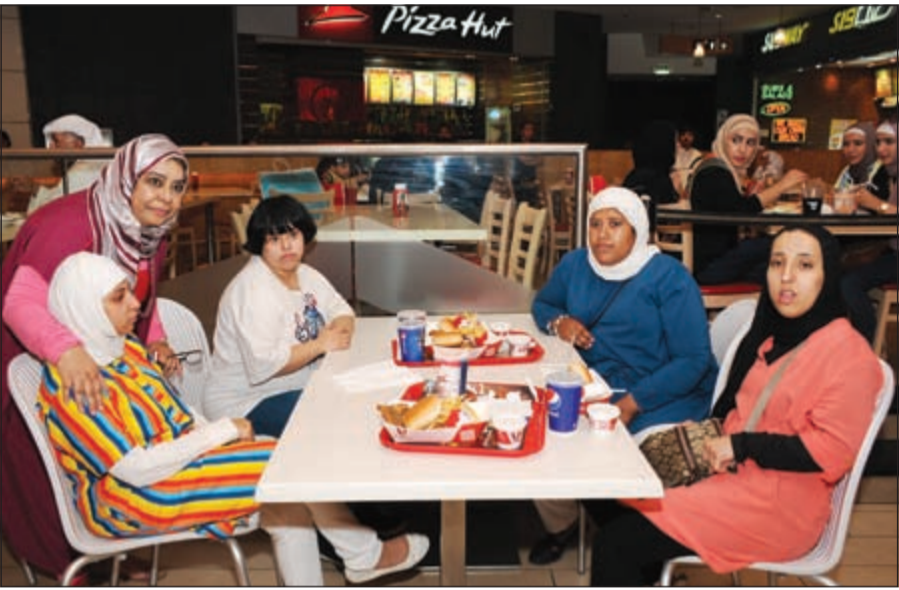
العبيد تشارك الأطفال فرحتهم