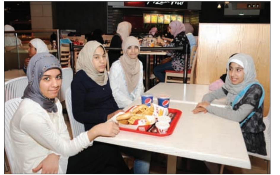
جانب من المشاركات في الرحلة

وأن الشركة دائما على اتم الاستعداد لمساعدة الأطفال من ذوي الاحتياجات الخاصة في الكويت وإدخال البهجة والسعادة الى نفوسهم، وهو دور اجتماعي لابد أن تهدف اليه جميع الشركات الكبرى من خلال المساهمة بالعمل على دمج هذه الفئة بالمجتمع وتقديم الدعم اللازم لإنجاح الأنشطة التي يشاركون بها في مختلف المجالات.