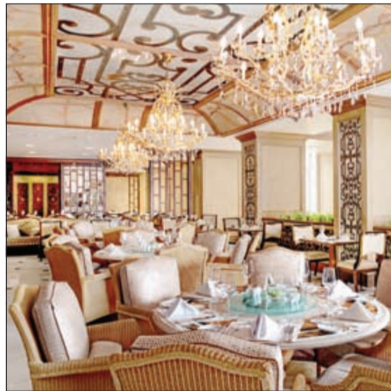
أشهى المذاقات التايلندية في مطعم طريق الحرير