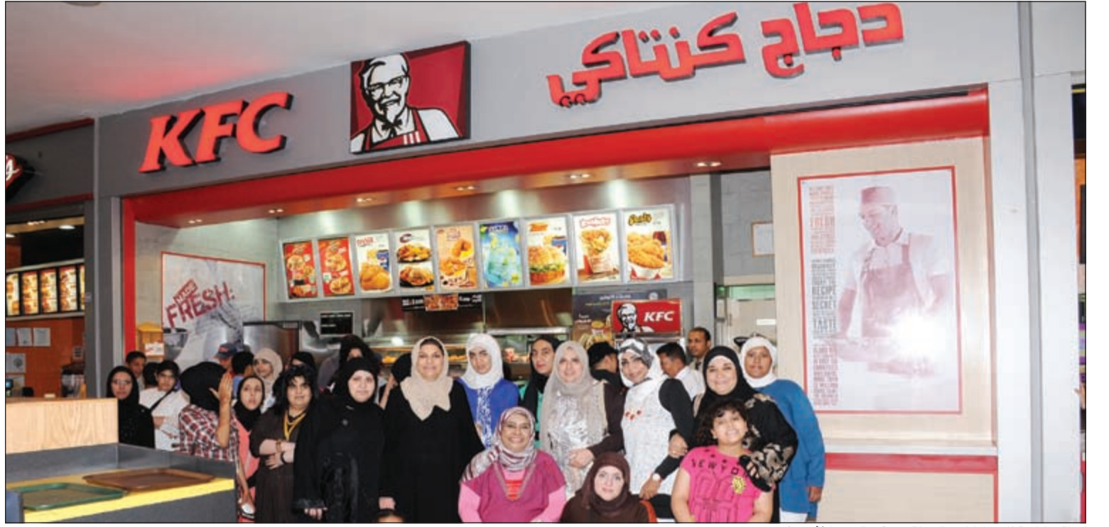
لغة تنكارية للمشاركة بالرحلة في (كنتاكي - الأفتيونز)