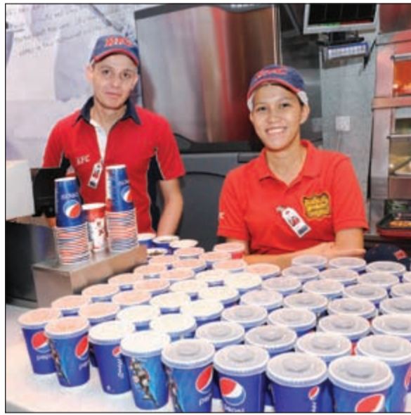
من فريق كنتاكي - الأفتيونز