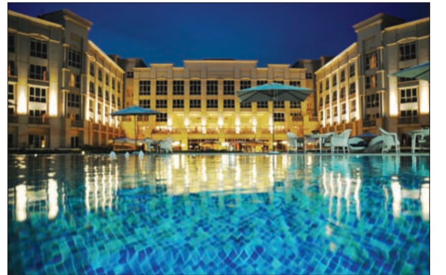
إطلالة بانورامية خلابة لفندق الريجنسي

سلطة البابايا التايلندية ومن الأطباق الرئيسية طبق الدجاج بالكاري الأخضر مع الباذنجان والريحان من أطباق الحلوى المانجو الطازجة مع الأرز وغيرها الكثير من الأطباق ذات المذاقات المميزة.