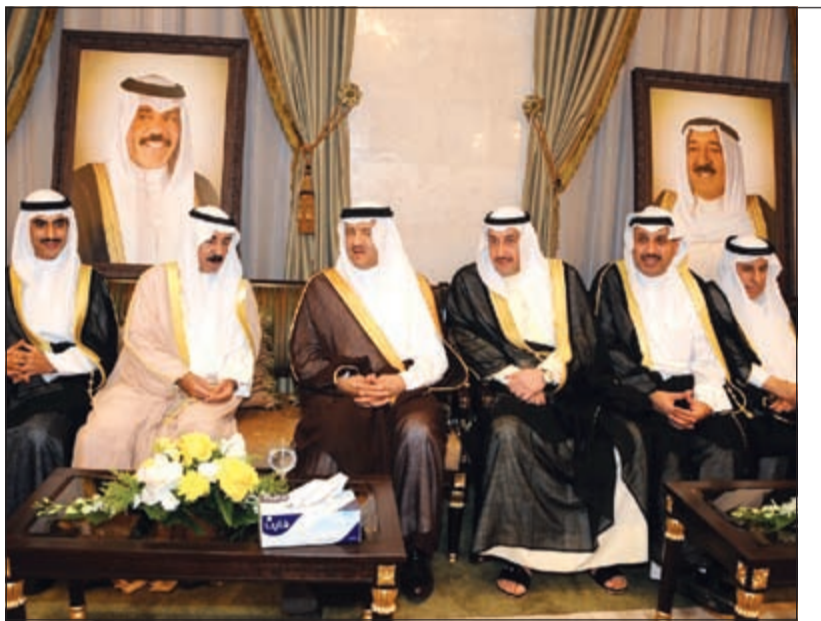
صاحب السمو الملكي الأمير سلطان بن سلمان والشيخ فيصل الحمود والشيخ حمد جابر العلي والسفير السعودي عبدالعزيز الغايز والشيخ سلطان بن حثلين والشيخ تامر جابر الأحمد خلال الزيارة (هاني الشمري)