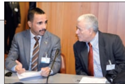
رئيس مجلس الأمة مرزوق الغانم خلال حضوره اجتماع ممثلي برلمانات دول «التعاون» في جنيف

الصانع: مؤتمر تمكين الكفاءات يتعلق بغياب مسطرة التعيينات وهدفه تحقيق العدالة الوظيفية 16