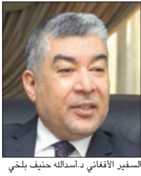
السفير الأفغاني د.سالد خان حنيف بلخي

السفير الأفغاني لـ «الأخبار»: أفغانستان على طريق المصالحة الوطنية وندعو المستثمرين الكويتيين إلى الاستفادة من الفرص السانحة في بلادنا