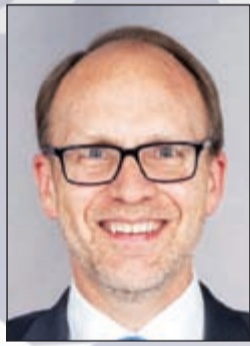
السفير الأميركي دوغلاس سيليمان