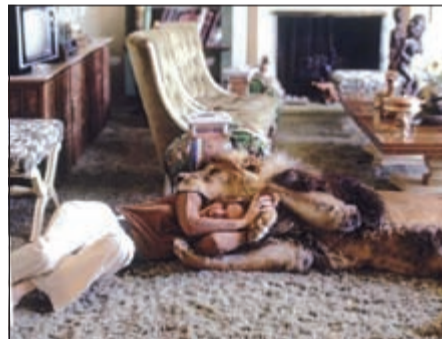
ميلاني تضع رأسها في فم الأسد مبتهجة وسعيدة

نيويورك - وكالات: في واقع قد لا يصدقها الكثيرون ويصفه البعض بأنه درب من دروب الجنون، اختارت عائلة الممثلة الأميركية ميلاني جريفيث أسداً ضخماً ليكون حيوانها الأليف الذي تعتني به داخل منزلها الخاص. وقد تبنت عائلة جريفيث الوحش الضخم «نيل» إبان رحلة إلى أفريقيا، قرروا خلالها عمل فيلم عن الأسود يحمل عنوان «الزئير»، استغرق إنتاجه 11 عاماً وبلغت تكلفته 17 مليون دولار، فيما حقق أرباحاً بلغت مليوني دولار فقط.