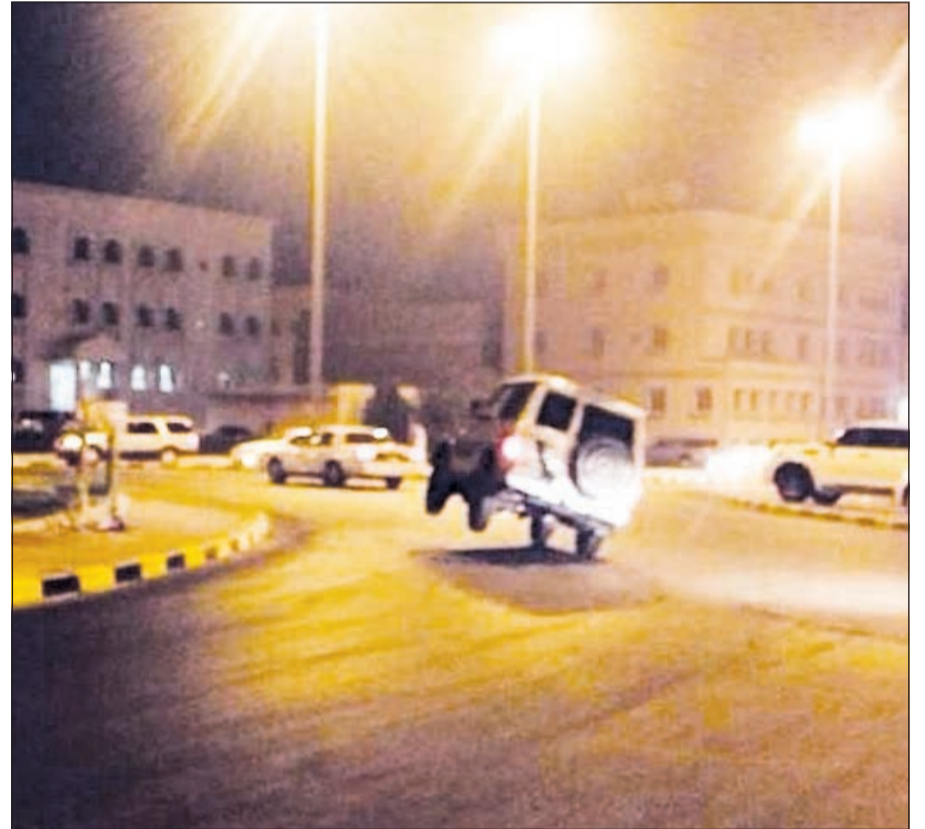
المستهتر خلال قيامه بأحدى الحركات الخطرة

فديبو لتوثيقها من أجل التوصل الى الرقم الصحيح للوحات المعدنية لسيارته وهو رقم غير واضح في جميع مقاطع الفيديو والصور التي جمعت عنه. وقال المصدر: إن مجموعة كبيرة من الشكاوى وردت حول المستهتر ووصلت الى رجال الأمن الذين أحالوها إلى رجال المباحث لتتابعها، مشيرًا الى وجود تنسيق بين رجال مباحث الفروانية ورجال مباحث المرور لكشف هوية المستهتر.