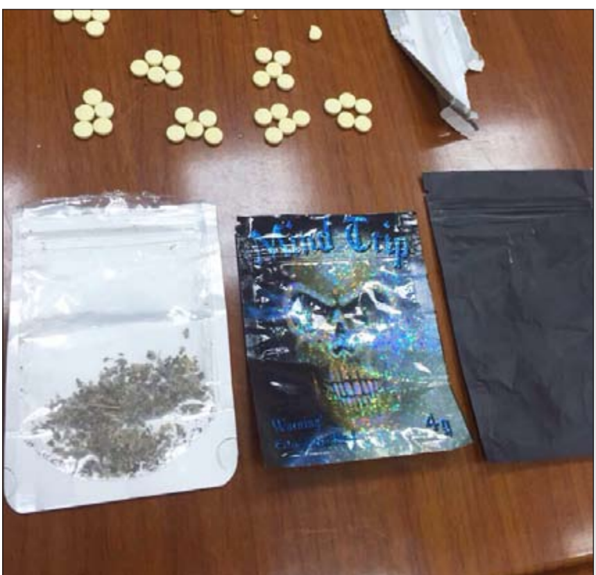
المخدرات المضبوطة بحوزة المتهمين الثلاثة

قضت محكمة الجنح المستأنفة بتأييد حكم البراءة الصادر بحق مواطن كانت طليقته قد اتهمته بضربها وسبها وتهديدها. وتتلخص الواقعة فيما ادعته طليقة المواطن بأن طليقها قام بالتعدي عليها أثناء تواجدها في مركز تنمية المجتمع في منطقة