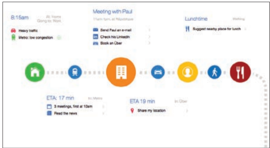
تطبيق «سنيس»... البرمجة الذكية لحياتك اليومية