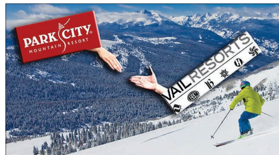
صفقة الاستحواذ على بارك سيتي قيمة مضافة إلى «فايل»

ومعظمها يتم تشغيلها من قبل بيك ريزورت Peak resorts. ومن منطلق ما يسميه كاتز «التنوع الماخي» فهو يمثل واحدة من الطرق لتحوط الشركة ضد تقلبات تساقط الثلوج، بينما خط الدفاع الأول بالنسبة لـ «فايل» هو جعل المنتجعات وجهاتها بغض النظر عن العناصر الطبيعية، من خلال وجود مجموعات من مناطق التزلج في بحيرة تاهو، روكيز كولورادو ويوتا، وضعف تساقط الثلوج في منطقة واحدة يمكن أن تقابله ظروف أفضل في أماكن أخرى. وتأخذ Vail Resorts» خطوة أخرى إلى الامام من خلال بيع المواسم التي تسمح لعملائها باستخدام أي من المنحدرات في جميع أنحاء البلاد، فضلا عن المنتجعات في سويسرا وفرنسا واليابان. وتستهدف «فايل» النخبة من عملائها وهي الطبقة الديموغرافية الفاخرة لاسيما