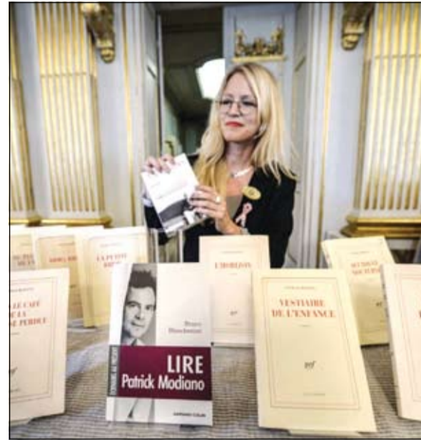
سيدة تستعرض بعض من مؤلفات باتريك موديانو

بروكسل - كونا: أعلنت الجهة المانحة لجائزة نوبل امس فوز الكاتب الفرنسي باتريك موديانو بجائزة نوبل في الآداب لعام 2014. وذكرت الأكاديمية السويدية ومقرها استوكهولم في بيان أن الجائزة منحت لموديانو لتسليط الضوء على «المصائر البشرية من خلال فن الذاكرة وكشفه للحياة البشرية في ظل الاحتلال». وأضافت الأكاديمية أن أعمال موديانو المولود في 30 يوليو 1945 تركزت حول مواضيع الذاكرة والشعور