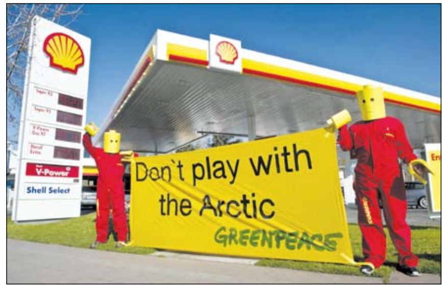
في الوقت الذي شهدت فيه مدينة سانتياغو عاصمة تشيلي مظاهرات منددة بعمليات اكتشاف للنفط والغاز في القطب الشمالي انخفضت أسعار النفط إلى مستويات متدنية أمس ودفعت العديد من الدول المستهلكة للنفط وعلى رأسها الصين إلى شراء النفط الخام بكميات كبيرة

ويتجاوز نمو واردات الصين من النفط منذ بداية العام الحالي معدل زيادتها البالغ 4٪ في 2013. وأثارت كميات النفط الكبيرة التي اشترتها تشاينا أوليت على منصة مؤسسة بلاتس للتداول ضجة في السوق وعززت خام دبي القياسي، وهو ما أثار مخاوف شركات التكرير الآسيوية من أن تكاليفها النفطية قد ترتفع بما يقلل من هوامش أرباحها.