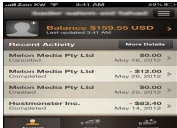
صور لحساب PayPal يوضح رصيدك البنكي بعد تسلم الأموال