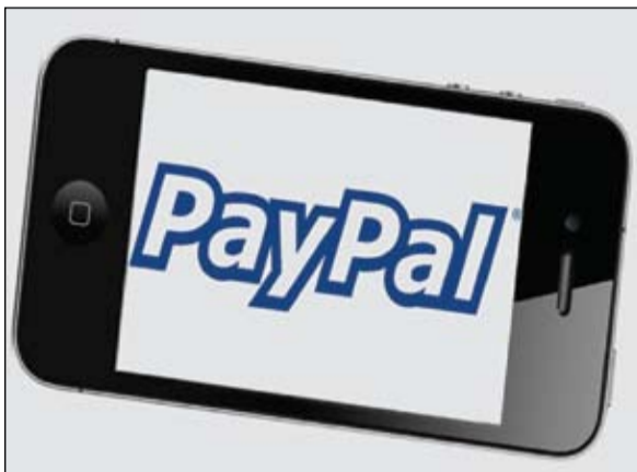
أصبح الدبل العصري لبطاقات الفيزا والماستر على الأجهزة الذكية