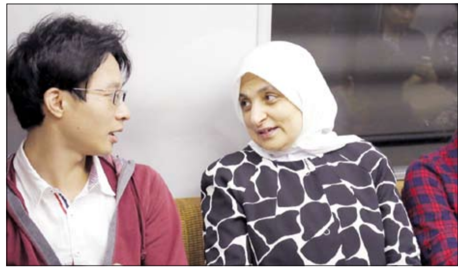
الصبيح خلال جولتها في مترو العاصمة اليابانية

وتخطط الكويت وفق خطة التنمية الوطنية الطموحة لبناء نظام مترو في البلاد يهدف الى معالجة مشكلة الازدحام المروري وخلق بيئة أفضل لنمو الأعمال التجارية والصناعية والأسواق السكنية. وضم الوفد المرافق للوزيرة الصبيح سفيرنا لدى اليابان عبدالرحمن العتيبي والأمين العام للمجلس الأعلى للتخطيط والتنمية هاشم الرفاعي ومسؤولين آخرين.