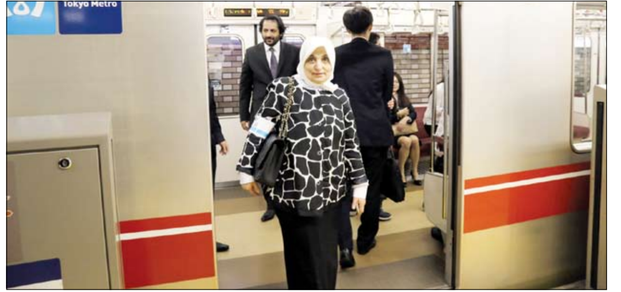
الوزيرة هند الصبيح تتفقد خطوط المترو في العاصمة اليابانية