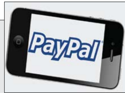
اصبح البديل المعصري لبطاقات الفيزا والمستر على الاجهزة الذكية

جلسات الـ «Tan» في الكويت.. بـ 80 ديناراً