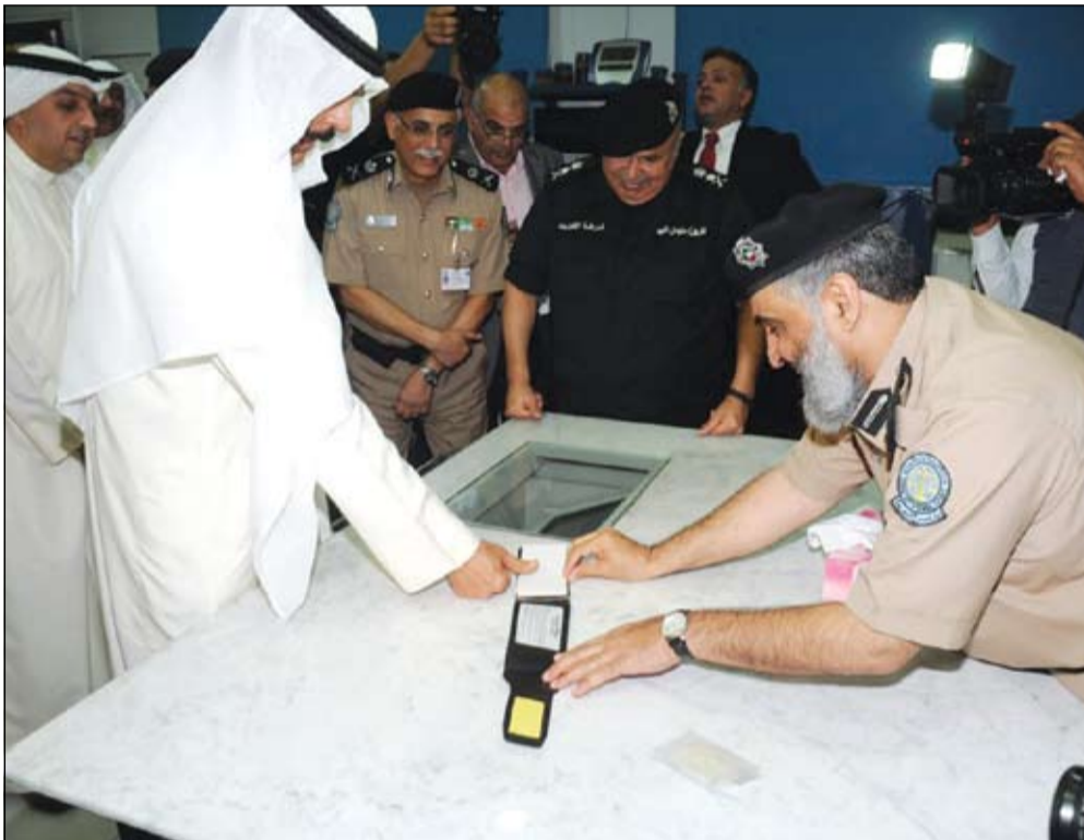
الشيخ محمد الخالد يطلع على تجربة الاستعراف بواسطة البصمة الوراثية بحضور الفريق سليمان الفهد وقيادات «الألة الجنائية»

وقالت مصادر في وزارة الكهرباء والماء: ان المشروع يتضمن تزويد وتركيب وتشغيل وصيانة معدات إنارة الشوارع لطريق الخليج العربي وتزويد وتركيب وتشغيل وصيانة معدات إنارة شوارع لطريق الملك فيصل المؤدي إلى مدخل المطار. وأوضحت المصادر انه سيتم التنسيق مع