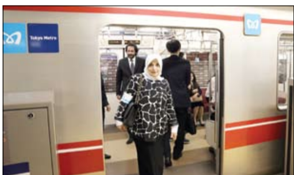
هند الصباح تفقد خطوط المترو في العاصمة اليابانية

طوكيو - كونا: تفقدت وزيرة الشؤون ووزيرة الدولة لشؤون التخطيط والتنمية هند الصباح خطوط المترو بالعاصمة اليابانية وأطلعت على التكنولوجيا المتقدمة في نظام التشغيل ومرافق محطات القطارات فضلاً عن تدابير السلامة والوقاية من الكوارث، إضافة إلى المرافق المخصصة فيها لذوي الاحتياجات الخاصة. وفي هذه الأثناء، وقّعت الصباح مع الجانب الياباني مذكرتي تفاهم للتعاون الثنائي بشأن مشروعات النقل والأشغال بما يتضمن تبادل الخبرات وتنمية الموارد البشرية. وقالت الوزيرة الصباح: