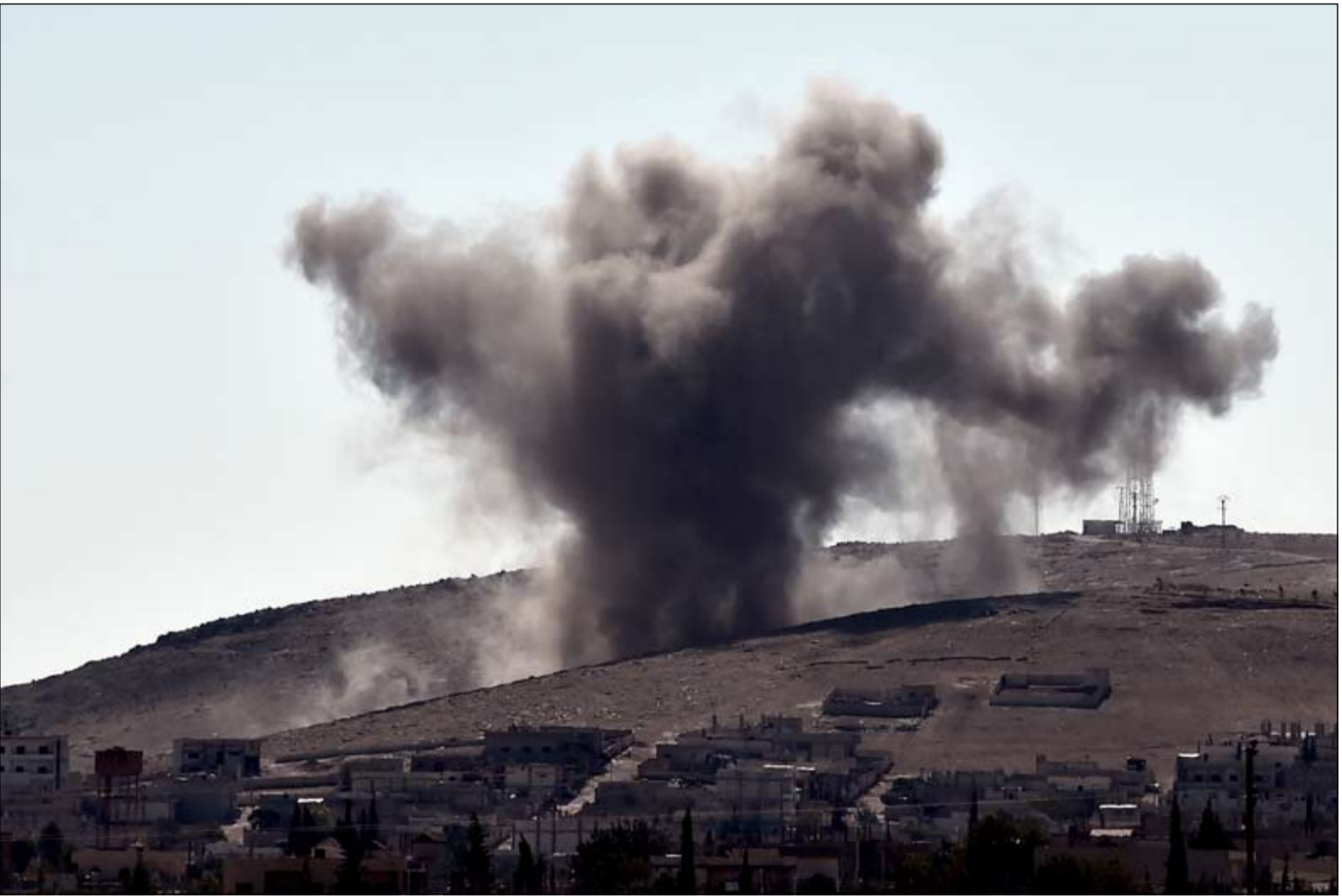
الدخان المتصاعد نتيجة غارة لقوات التحالف على المنطقة الشرقية في عين العرب

ويعد الظهر وقعت أولى المواجهات بين متظاهرين اكراد وقوات الأمن. وفي بعض الاحياء استخدم ناشطون مقربون من حزب العمال