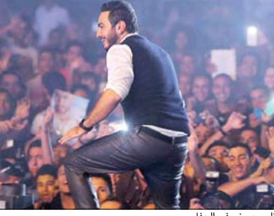
تامر حسني في الحفل

الأغنية التي حملت عنوان اليوم الجديد الذي طرحه منذ أسابيع قليلة، وكانت المفاجأة في ظهور شبيه تامر حسني على المسرح، حيث اعتقد الجمهور في البداية أنه تامر إلا أنه خرج من الجهة الأخرى وهو يعني «180 درجة». وكانت الاستعدادات للحفل قد بدأت قبله بأيام، كما حرص تامر على الحضور قبله بساعات من أجل الاطمئنان إلى جاهزية المسرح وأجهزة الصوت وغيرها من التجهيزات اللازمة ليجري بروفة خاصة مع فرقته على