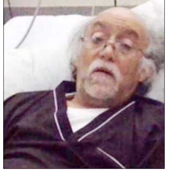
الفنان القطري علي سلطان