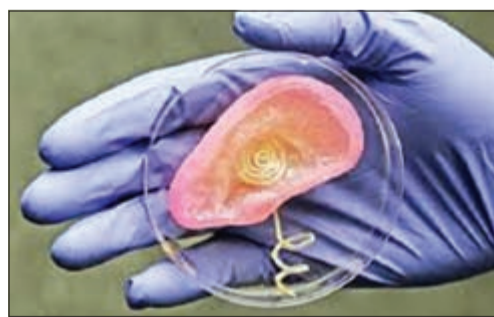
آذن ثلاثية الأبعاد

وكان العلماء أثبتوا في السابق إمكانية تخليق آذان وتنميتها