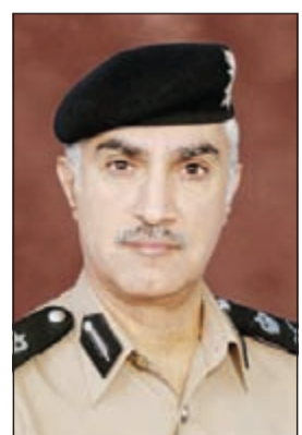
اللواء إبراهيم الطراح