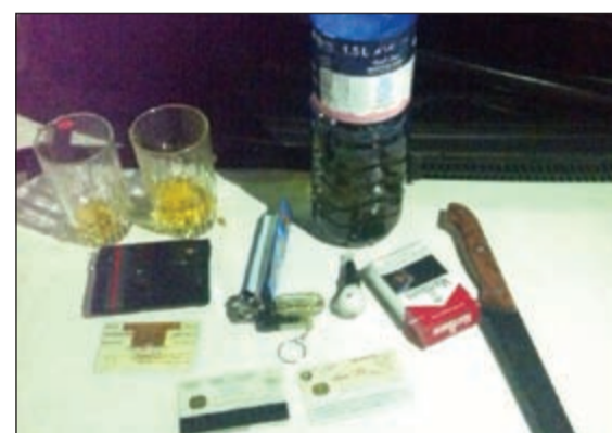
المواد المخدرة والمسكرة المضبوطة في مركبة اللصوص

احتواؤها على مواد مسكرة وأدوات حادة ومواد مخدرة وأدوات تعاط. وبحسب مصدر أمني فإن عمليات وزارة الداخلية تلقت بلاغاً بقيام 3 أشخاص باعتراف وافد هندي وطعنه بعد رفضه أن يسلم لهم ما بحوزته من أغراض، وعليه أمر مدير أمن محافظة الجهراء اللواء إبراهيم الطراح بإرسال دوريتين إلى موقع البلاغ بقيادة الرقيب فايز راهي ووكيل عريف عبدالله عجاج والدورية