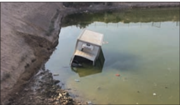
الهاق لوري كادت المياه ان تغمره بالكامل