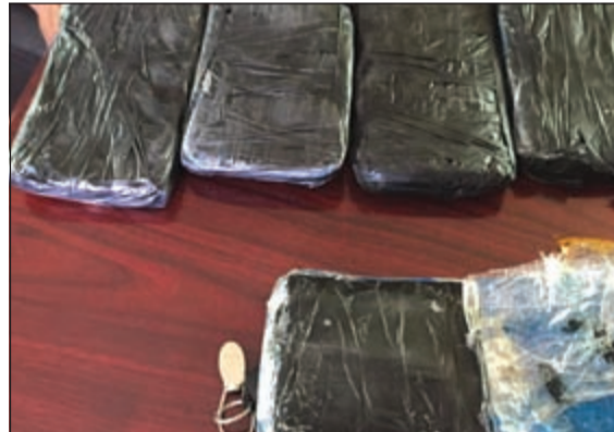
السائق الآسيوي قاوم التفتين ومباحث حولي تتبعته المعلومة