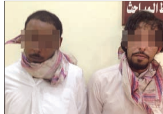
المتهمان حاولا انتشال المخدرات من شاحنة الآسيوي