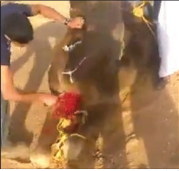
القتاب يشرع في نحر الجمل