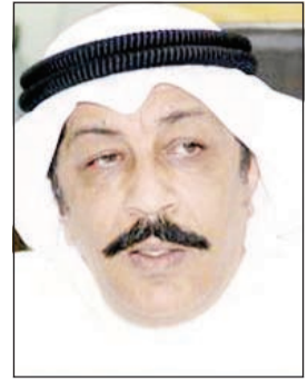
اللواء عبد الحميد العوضي

لتورطه في هذه القضايا إلا أن رجال المباحث ضيقوا الخناق وتم عرضه على عدد من المجني عليهم في عدة طوابير عرض، وازاء مواجهة المتهم بمعلومات تؤكد تورطه في قضايا سلب وتعريف المجني عليهم عليه اضطر المتهم للاعتراف تفصيلاً بجرائمه، مشيراً إلى أنه نفذ نحو 30 قضية سلب بالإكراه، إذ كان يوقف الوافدين لاسيما الآسيويين بعد أن يشغل فلاشر خاصاً برجال الأمن ومن ثم يبلغ المجني عليهم بأنه من رجال الأمن ويطلب تفتيشهم لأنهم مشتبه فيهم ومن ثم يقوم بسلب ما بحوزتهم من مبالغ مالية ويطلب منهم مراجعة المخفر القريب ويفر هارياً. وأكد المصدر ان رجال المباحث عثروا بحوزة المتهم على الفلاشر وكمية من المسروقات والتي تنوعت بين بطاقات بنكية وهويات رسمية وهواتف نقالة إلى جانب لوحات مركبات كان يقوم المتهم بسرقتها ووضعها على سيارته، بحيث إذا التقط المجني عليهم رقم اللوحة يتكشف رجال الأمن ان اللوحة مبلغ عن سرقتها.