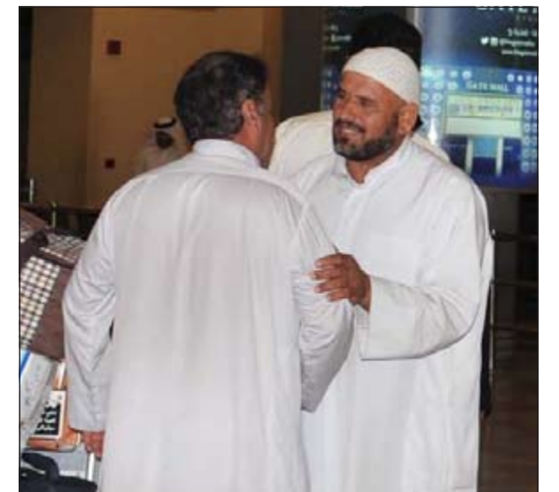
الحمد لله على السلامة