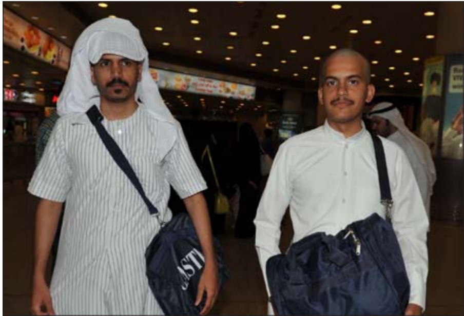
حاجان لدى وصولهما ارض الوطن