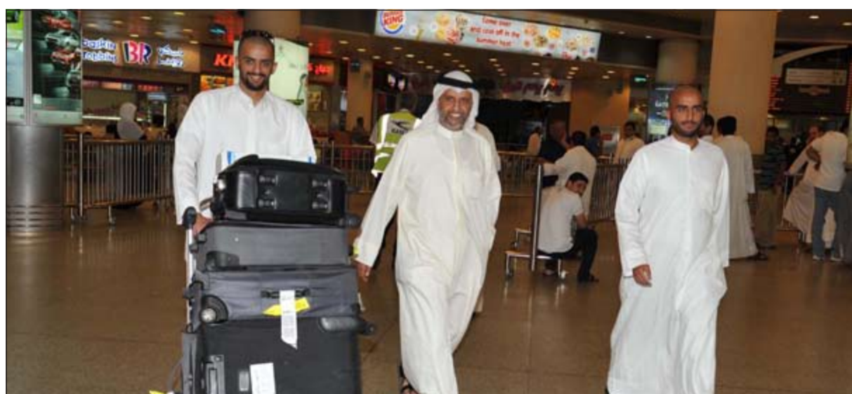
حجاج لدى وصولهم الى المطار