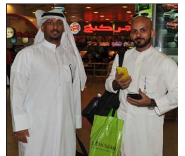
فيلان ومسفر الجمعي

لوزارة الداخلية وإدارة المطار وإدارة الجمارك ومراقبة الطيران على حسن تعاملهم مع وسائل الإعلام وحجاج بيت الله، فلهم كل الشكر والتقدير.