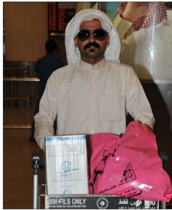
احد الحجاج لدى عودته