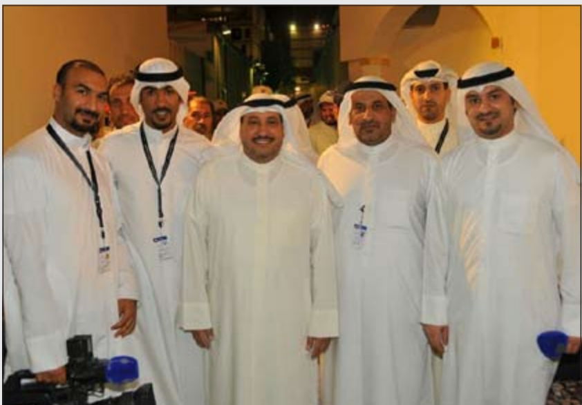
مجموعة من أعضاء بعثة الحج الكويتية أثناء تواجدهم في المشاعر المقدسة لخدمة الحجاج

وأوضح أن تناغم العمل بين فرق ولجان البعثة لم يأت مصادفة أو تحقق في وقت قصير إنما هو نتاج عمل منظم بدأ قبل أشهر بمشاركة وزارات وهيئات ومؤسسات الدولة المعنية بالعمل ضمن بعثة الحج لوضع آلية كاملة وشاملة لجميع تحركات جموع الحجاج منذ انطلاقتهم من الكويت وحتى عودتهم من الأراضي المقدسة بعد أدائهم لمناسكهم.