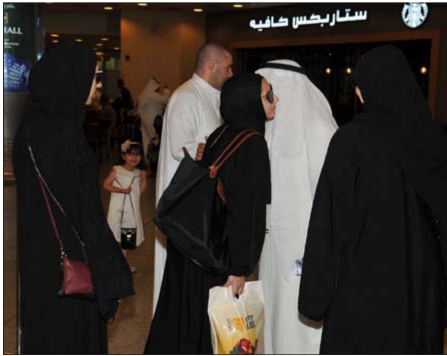
حج مبرور وذنب مغفور

وأضاف أن البعثة «أكدت قدرة الفرق العاملة فيها والمثلة لوزارات عدة على تحقيق الشراكة بالعمل وتفعيل تطبيق استراتيجية وزارة الأوقاف في الشراكة مع الجميع وتحقيق التكامل بالعمل المشترك ما ظهر جليا خلال موسم الحج حيث عملت البعثة كفريق واحد متكامل ومتناغم وأدت مهامها بنجاح منقطع النظير».