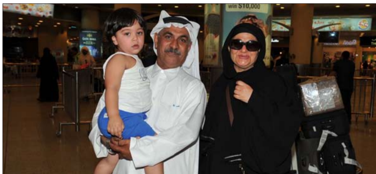
طفلة في استقبال والديها