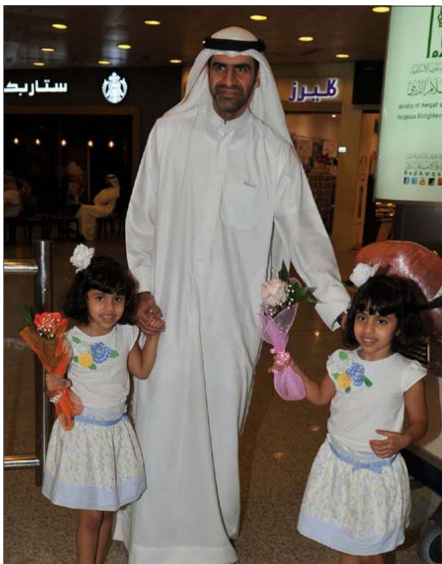
حاج وباستقباله طفلته

مشيرا إلى ان مشكلة الحج هذا العام هو ارتفاع أسعار الحملات ويرجع ذلك إلى تقليص اعدد الحجاج الكويتيين وكذلك تحديد عدد محدد لكل حملة مما اضطر اصحاب الحملات إلى رفع الاسعار حتى تغطي التكاليف.