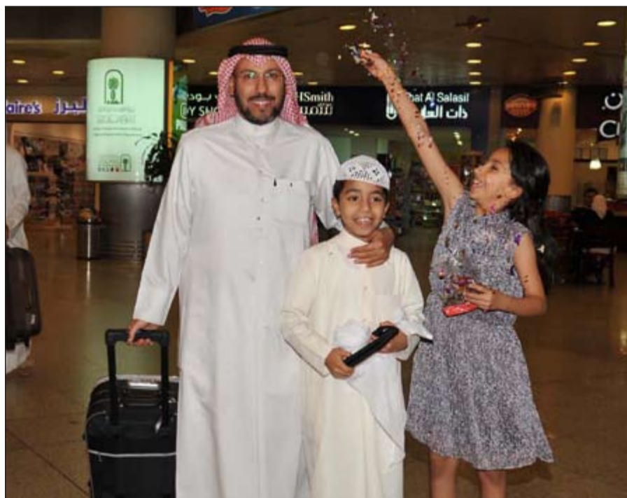
طفلة تستقبل والدها الحاج بالورود