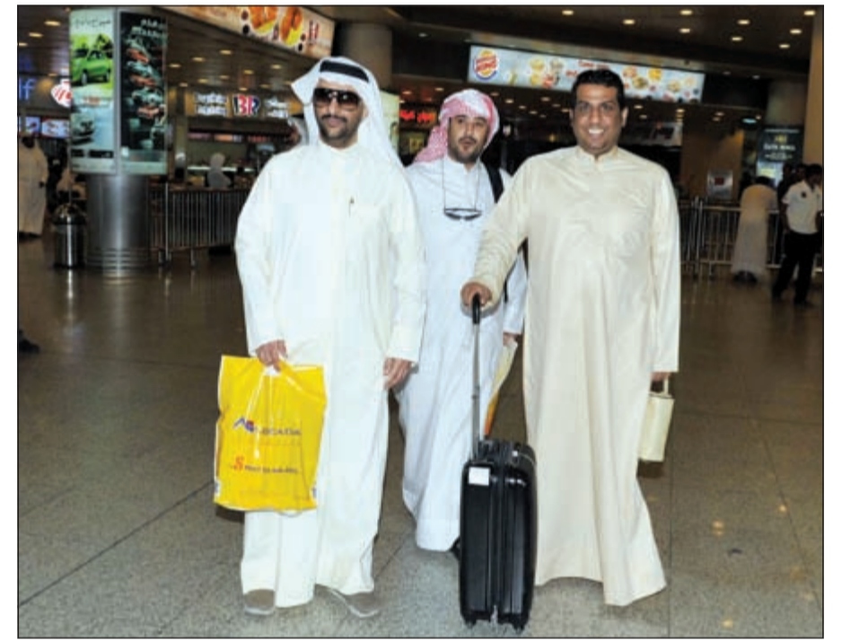
العودة بسلام إلى أرض الوطن

الحج هذا العام كان أكثر سهولة بفضل الجهود والتسهيلات التي قدمتها المملكة العربية السعودية، مشيراً إلى أن الحكومة السعودية كانت تحل جميع المشكلات التي كانت تواجه الحجاج في الأعوام السابقة. وبين أنه كان متخوفاً من الذهاب بسبب ما كان يتردد حول ضيق صحن الطواف بسبب التوسعة وتقليص أعداد الحجيج، إلا أنه لم يلاحظ أي مشاكل في الطواف بل كان سهلاً على جميع الحجيج.