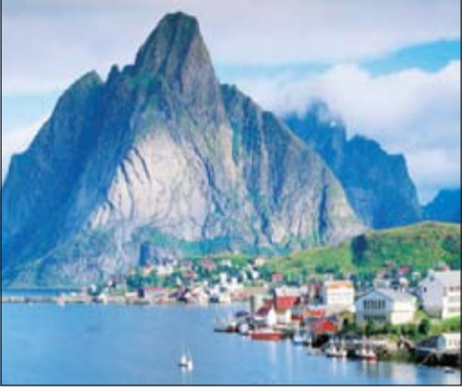
النرويج تصدر قائمة أفضل البلدان لناحية مستوى معيشة المسنين