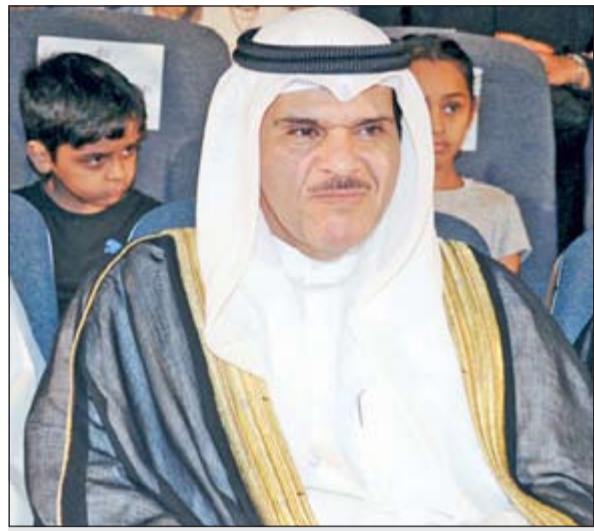
وزير الإعلام الشيخ سلمان الحمود