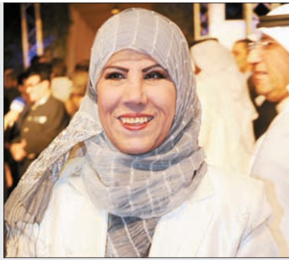
الفنانة القديرة مريم الصالح