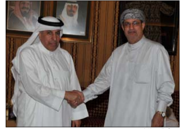
تهنئة بالعيد المبارك