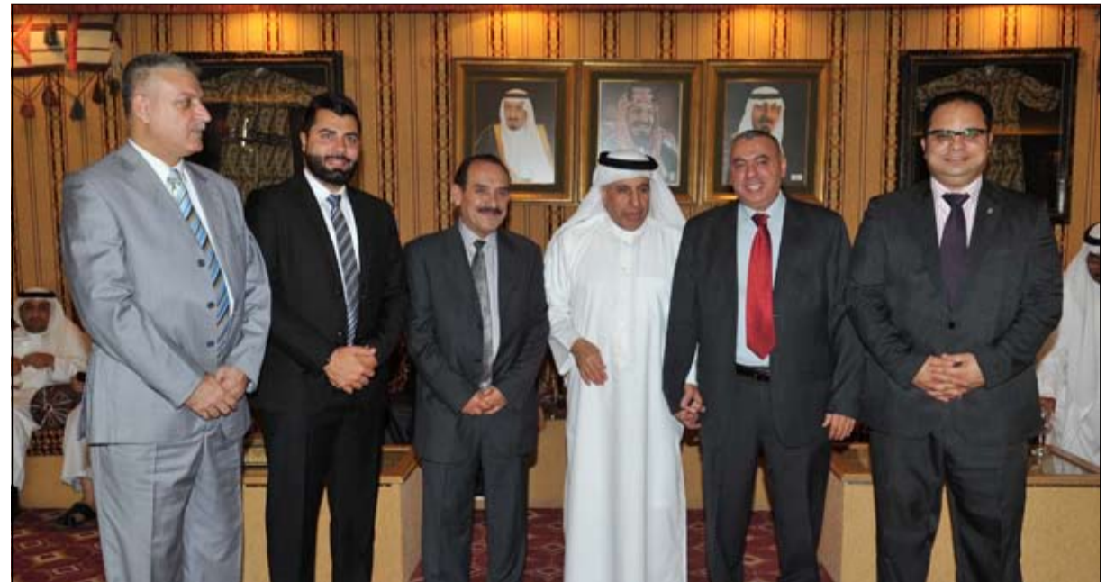
د.الفايز وعدد من المهتمين