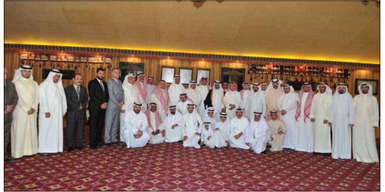
السفير السعودي د.عبدالعزيز الفايز وعدد من المهتمين