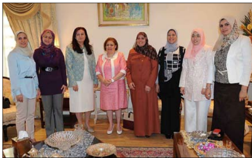
حرم السفير المصري مستقبلة عددا من المهتمات