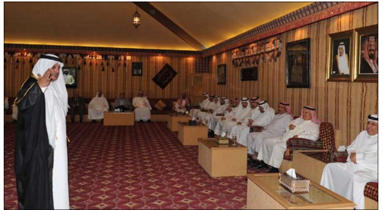
مداخلة من أحد المهتمين نالت إعجاب الحضور