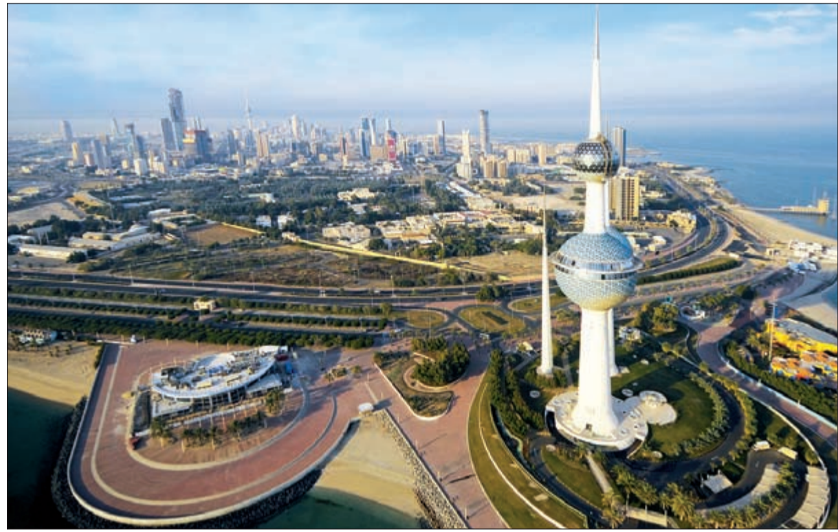
السياحة الداخلية تنتعش خلال عطلة عيد الأضحى

وحول الأماكن والمنتزهات التي يفترض أن يرتادها الجمهور بالعيد حديقة الحيوان المتنفس الطبيعي الوحيد في الكويت الذي يقضي فيه المواطنون والمقيمون يوم عيدهم ويجعلون منه متنفساً حقيقياً للاستمتاع مع مجموعة تآدرة من الطيور والحيوانات، إضافة إلى أن حديقة حجازة مسرح للأطفال وقطار يطوف أرجاءها المركز العلمي وتتميز الكويت بسياحة نوعية، على غرار المركز العلمي الذي يستقطب نحو 7 آلاف زائر على مدى الأيام 3 الأولى من عطلة العيد الأضحى وهو مكان يجمع بين الترفيه والتعليم في أجواء