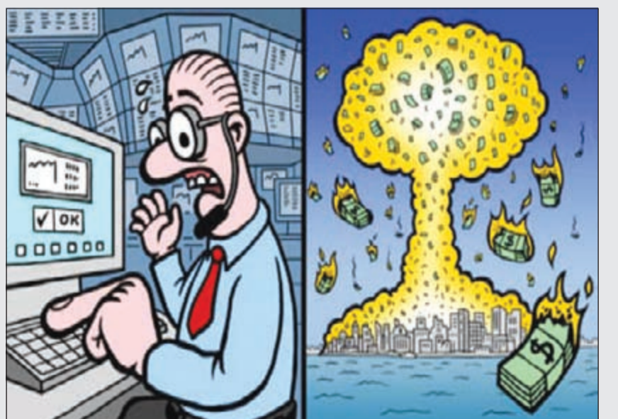
خطأ الأصبع الضخمة يتسبب في إلغاء أوامر شراء بقيمة 617 مليار دولار