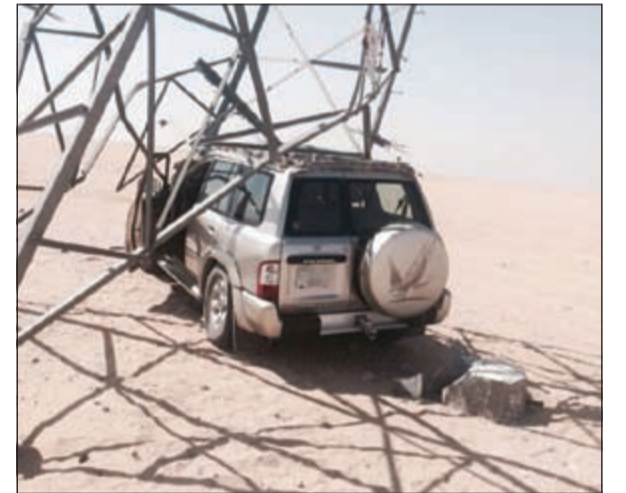
السيارة رباعية الدفع كما اصطدمت ببرج الضغط العالي

العالي، ونقل على إثرها للمستشفى بعد أن لحقت به إصابات استدعت دخوله غرفة العمليات الصغرى. وقال مصدر أمني إن بلاغا ورد الي غرفة عمليات الداخلية