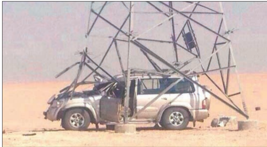
آثار الحادث على السيارة

منطقة الخباري، غير أن الصقر وعندما حاول إزالة قناعه عنه ليطلقه أقلت منه ما جعل توازن عجلة القيادة يختل في يد المواطن لتتحرف وتصطدم بعمود الضغط العالي.