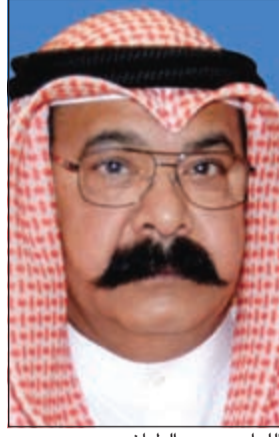
اللواء محمود الطبايح