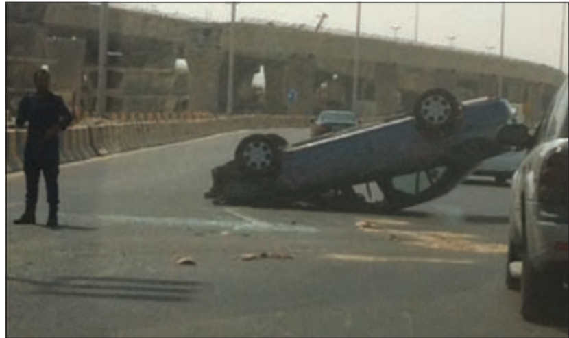
السيارة المنقلبة ورجال المرور يتابعون الحادث

وقال مصدر أمني إن بلاغا ورد عن وقوع حادث انقلاب مركبة على طريق الدائري الرابع، وتوجه رجال الإسعاف ومرور العاصمة، حيث قام المسعفون بعمل الإجراءات اللازمة إلى المصاب ونقله إلى المستشفى وتم سحب المركبة حتى لا تتم عرقلة السير عن طريق ونش الداخلي.