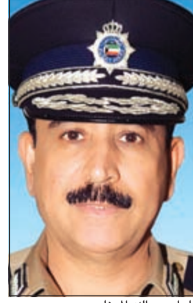
اللواء عبدالله المهنا