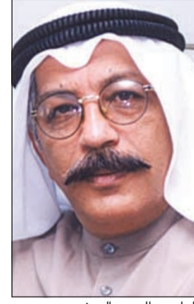
اللواء عبدالحميد العوضي