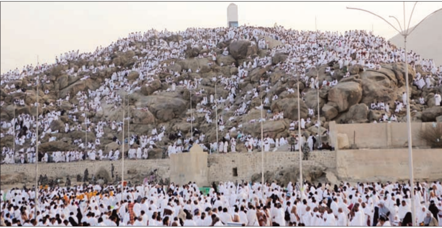
حجاج بيت الله الحرام على جبل عرفات

رئيس الوزراء اطمأن على أحوال الحجاج ونقل تهاني الأمير وولي العهد