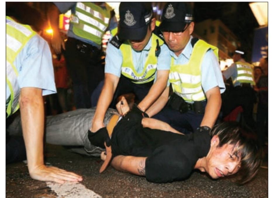
الشرطة تعتقل أحد المتظاهرين المؤيدين للديموقراطية ضمن احتجاجات هونغ كونغ (رويترز)

وقال «بما أننا مجتمع متحضر، لم يعد من المسموح وقوع مثل هذه الحوادث». وأمل الطلبة الذين شكلوا رأس جربة الحركة الاحتجاجية، رئيس الحكومة حتى منتصف الليلة قبل الماضية. وقبيل انتهاء المهلة رفض رئيس الوزراء، كما كان متوقفاً، الاستجابة للطلب واقترح على الطلبة بدء حوار مع الأمانة العامة للحكومة.