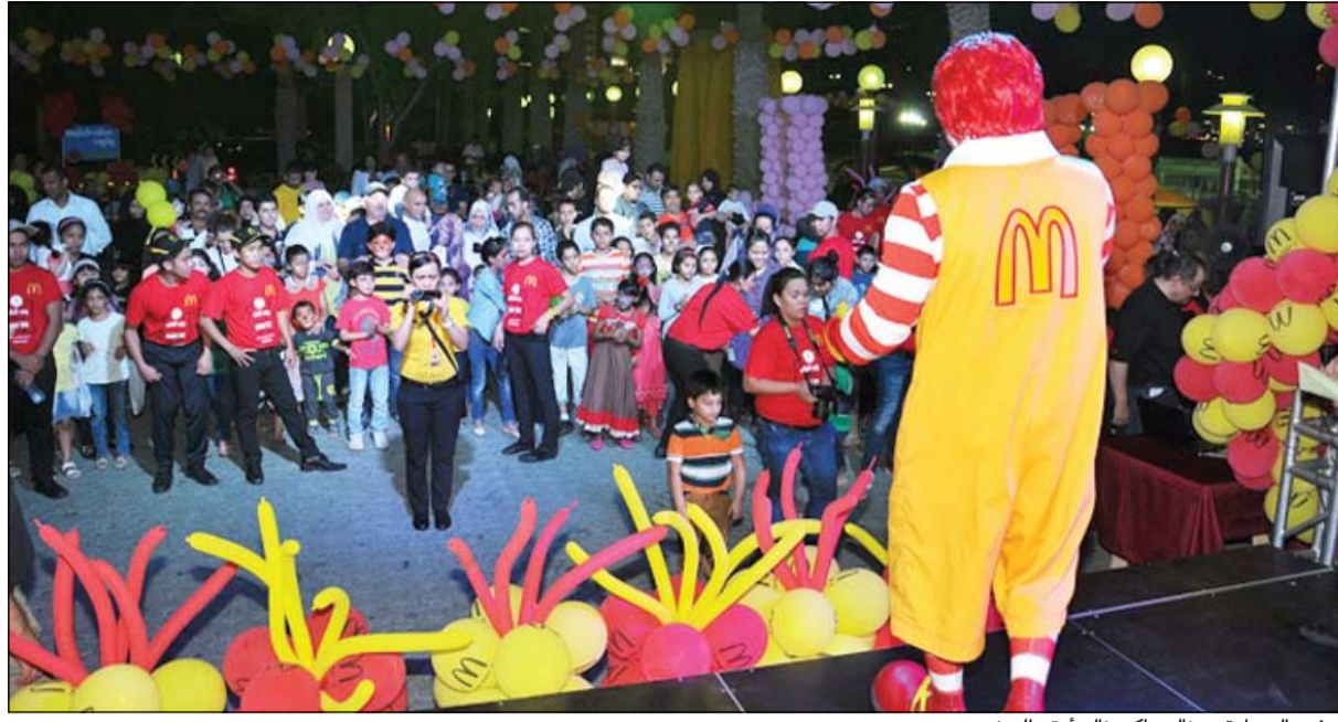
سفير السعادة رونالد ماكدونالد أمتع الحضور

بعد «لواند لو هايبرماركت»، وجهة التسوق المتميزة لأغراض أسلوب الحياة، ويقدم لعملائه من أجل موسم الشتاء عرضه «استعد للشتاء»، الذي يقدم ملابس الشتاء المريحة والعصرية بأسعار خاصة. ويشمل العرض، المتوافر في جميع منافذه، مجموعة متنوعة ومفيدة من ملابس واكسسوارات الشتاء التي تضمن للعملاء الدفاء طوال موسم الشتاء. وتعد العروض الرائعة متوافرة خلال العرض الخاص في لواند لو هايبرماركت من أجل جميع احتياجاتكم من ملابس الشتاء العصرية إلى الأحذية الأنيقة. ويضمن العرض جودة لا تضاهي للوازم الشتاء بأسعار تنافسية. ومن بين المواد المفضلة في مجموعة ملابس الشتاء يوجد عدد من السترات والبُلُوزات واكسسوارات ملابس الشتاء الأنيقة التي تجمع بين المتانة والأناقة. كما يقدم العرض مجموعة الأطفال التي تتميز بالمرح والعصرية وتمكن طفلك من الظهور بالمظهر الأنيق بأسعار معقولة. ويقوم لواند لو هايبرماركت ببناء قاعدة عملاء قوية ومخصصة ومتزايدة على مدار العديد من الأعوام ويتعهد بتزويد العملاء بالجودة وخبرة التسوق ميسورة التكلفة.