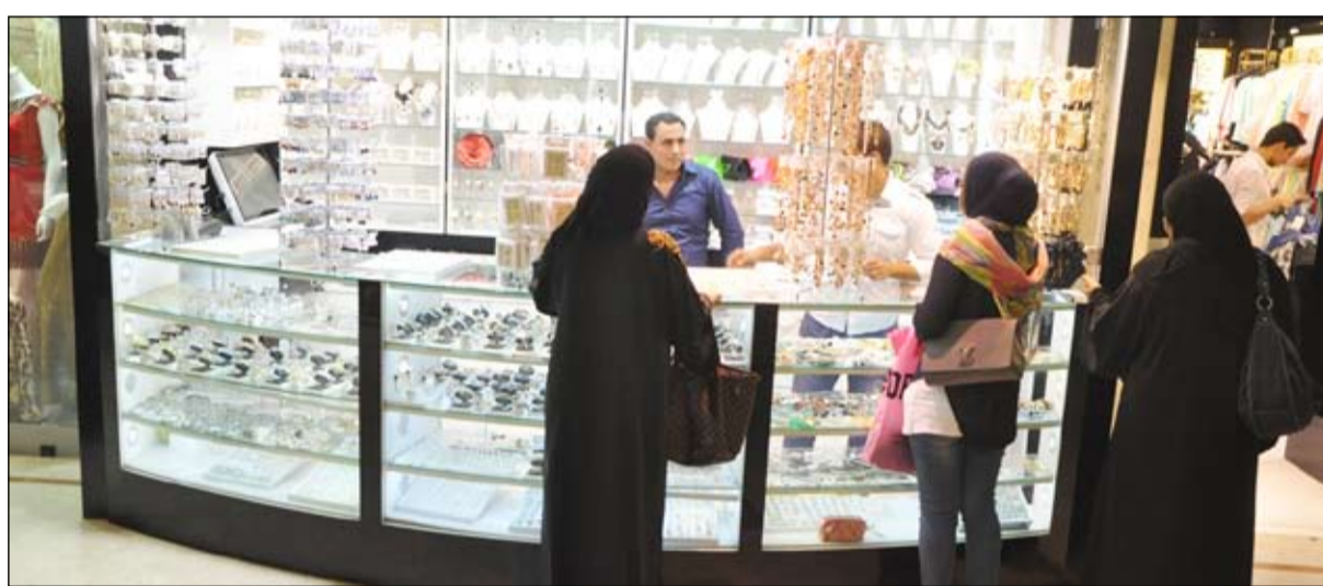
أقبال على شراء الأكسسوارات النسائية