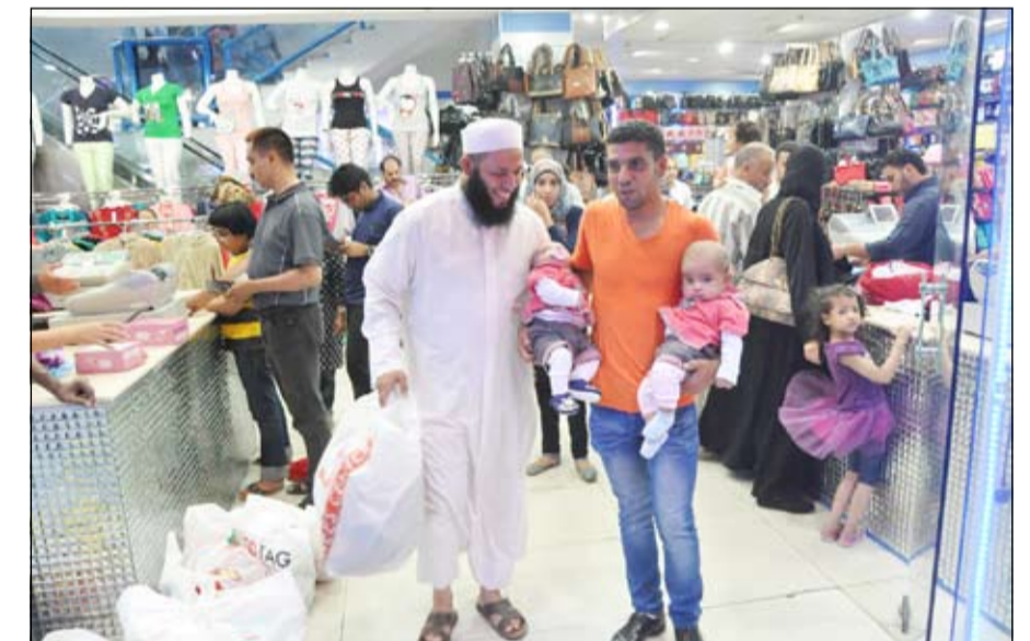
للملابس الجديدة فرحة خاصة

أكدوا أن القوة الشرائية في الكويت متوافرة مقارنة بالدول الأخرى ولكن اهتمامات الناس تنصب على شراء الأضاحي أكثر