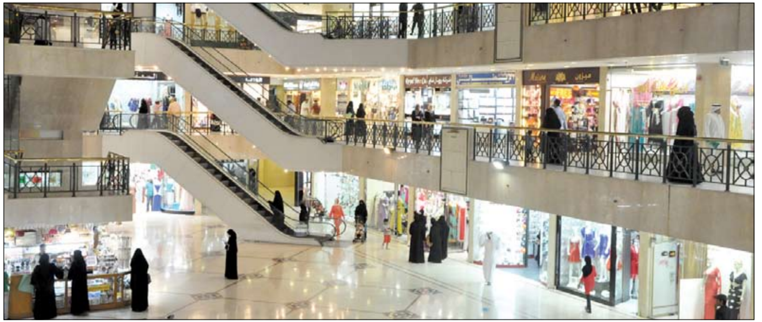
الأطفال لهم النميب الأكبر في شراء ملابس العيد

مواطنون لـ «الأنباء»: فرحة الأطفال لا تكتمل إلا بالملابس الجديدة.. وأهمية العيد تكمن في صلة الأرحام والإحسان للفقراء والمحتاجين بتوزيع الأضاحي