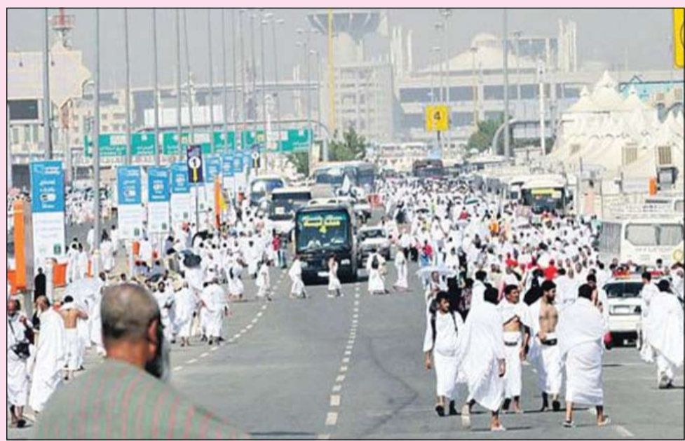
الحجاج يستعدون للمسعود إلى عرفة ليؤدوا ركن الحج الأعظم

الفلاح: اكتشاف 150 تصريح حج مزورا لحجاج غير رسميين من الكويت