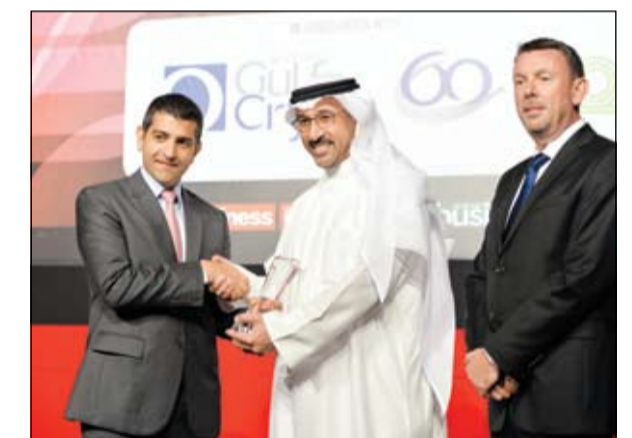
د. حمد الحساوي خلال تسلم جائزة التكريم

حصل د. حمد علي الحساوي أمين عام اتحاد مصارف الكويت على جائزة التكريم الخاص من مجلة أريان بزنس. وقد جاء هذا التكريم الخاص تقديرا للجهود التي بذلها د. حمد الحساوي من خلال عمله أمين عام اتحاد مصارف الكويت منذ 2011 ودوره القيادي ومساهماته الفعالة في القطاعين المالي والاستثماري، حيث تقلد عدة مناصب لدى مؤسسات مرموقة مثل مؤسسة الخليج للاستثمار وشركة مشاريع الكويت لإدارة الأصول الاستثمارية وشركة الخليج قابضة وشركة رساميل للهيكلية المالية، هذا بالإضافة إلى دوره الاستشاري، حيث