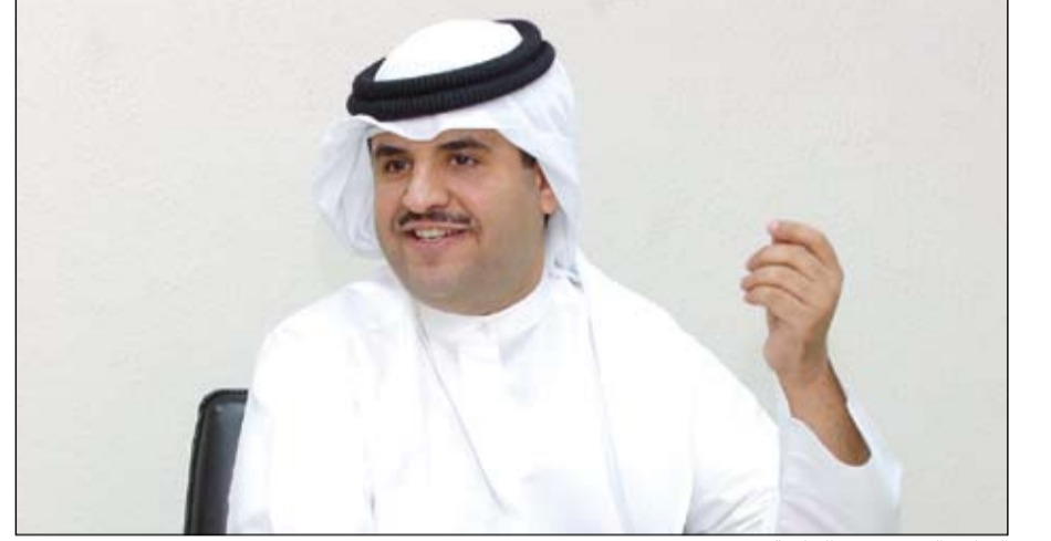
الشاعر الشيخ دعيج الخليفة

اعتباراً من الأحد المقبل سوف يتم تغيير اللوغو الخاص بشركة السينما الكويتية، وذلك بمناسبة مرور