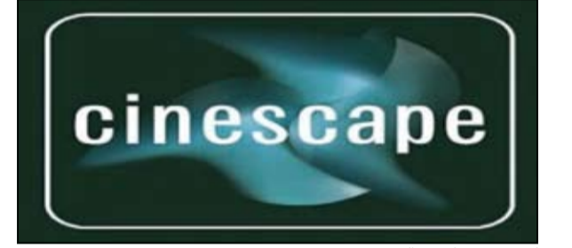
لوغو «سنسكيب» القديم

اعتباراً من الأحد المقبل سوف يتم تغيير اللوغو الخاص بشركة السينما الكويتية، وذلك بمناسبة مرور