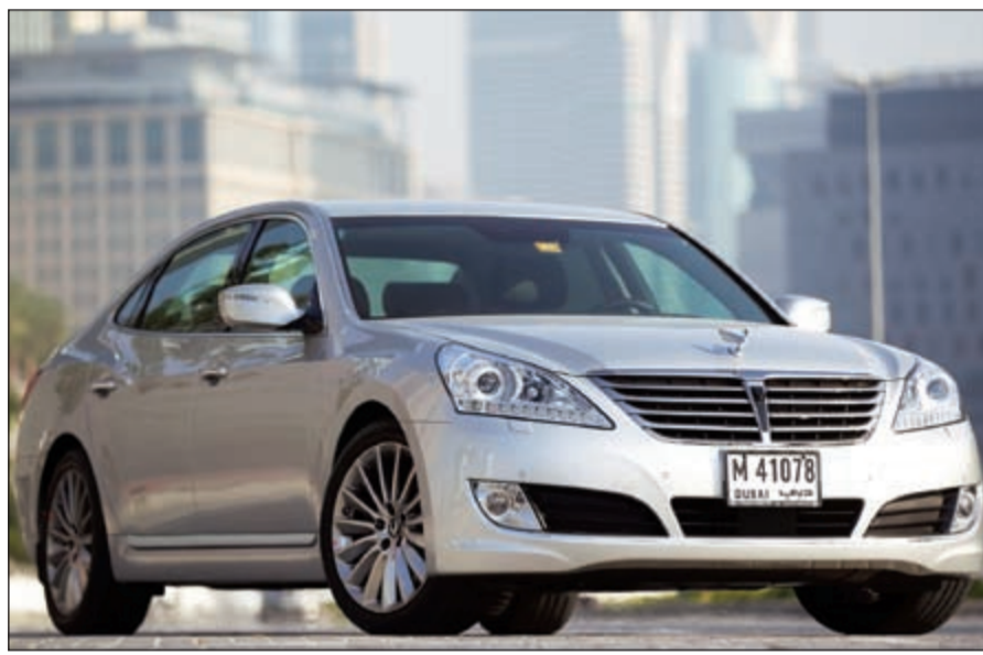
«هيونداي سننتينال» طراز 2014

الأوسط: «تحظى مجموعة سياراتنا الراقية بكثير من التقدير على المستوى العالمي نظراً لما تتمتع به من معايير عالية من ناحية الجودة، التصميم والتقنيات التي توفرها للعملاء، وتمثل «سننتينال» و«جنيسيس» التي تعتمد العلامة التجارية، ولقد فزنا بعدد من أبرز الجوائز ضمن قطاع السيارات في كل من الشرق الأوسط وباقي دول العالم. ويشكل «برنامج الضمان المتميز بلاس» من «هيونداي» دليلاً آخر على مدى ثقتنا بهذه السيارات، ونعتبر أنه يضيف قيمة كبيرة جداً إلى المتعة الكاملة المرتبطة بتجربة ملكية هذه السيارات.»