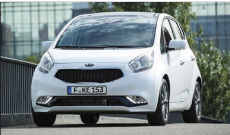
كيا فينجا متعددة الأغراض ذات الشعبية الواسعة