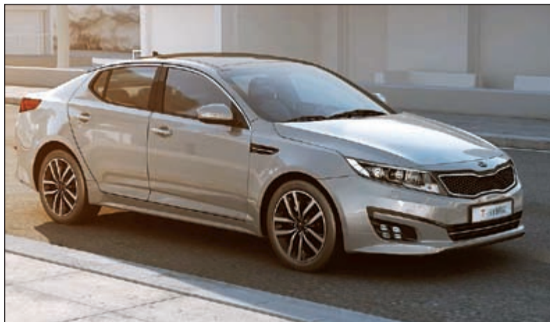
كيا أوبتيما الهجينة الجديدة