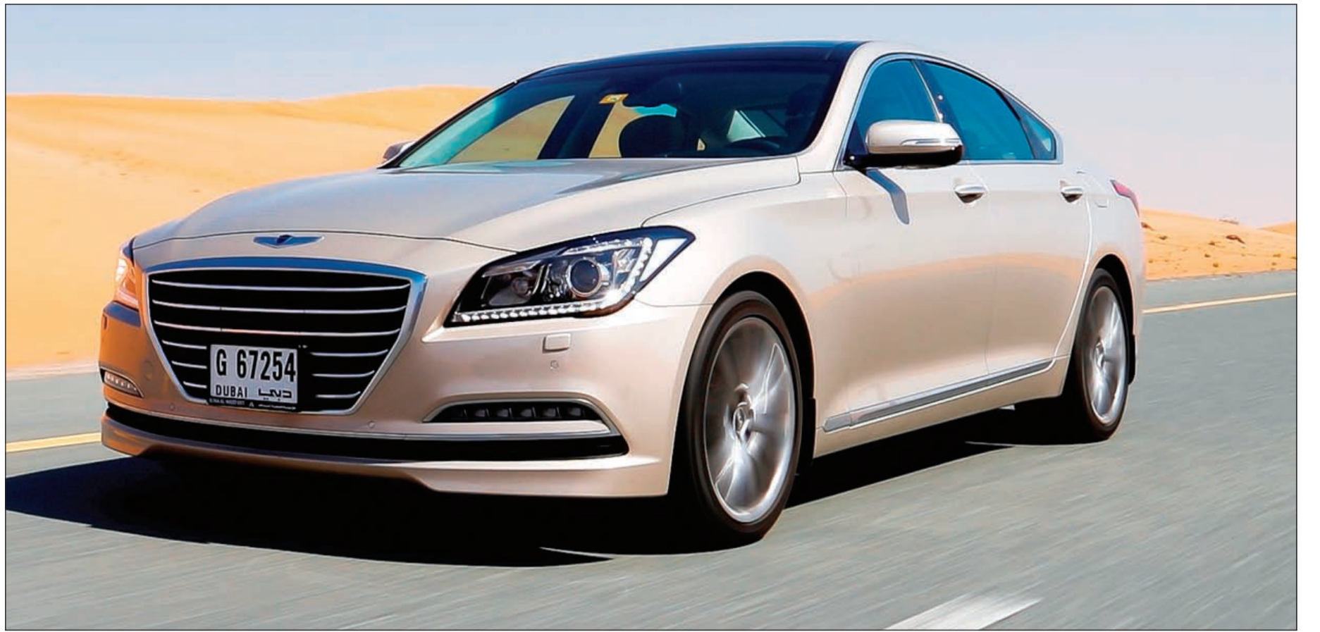
«جنيسيس» الجديدة كلياً من «هيونداي»

ويمكن فتح حساب الثريا بكل سهولة، يتعين على العملاء زيارة أي من فروع بنك برقان للحصول على كافة التفاصيل، أو عبر الاتصال بمرکز خدمة العملاء 1804080. وللمزيد من المعلومات يرجى زيارة الموقع الإلكتروني للبنك www.burgan.com.