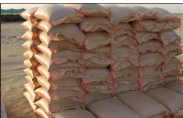
إزالة مواقع بيع الأعلاف يؤدي إلى ارتفاع أسعارها