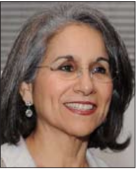
الشيخة حصة الصباح

وإعادة الحياة له ليكون فندقا يستقبل عشاق الفن والثقافة.