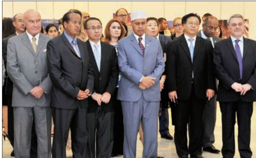
سفيراً العراق والصومال وعدد من الدبلوماسيين