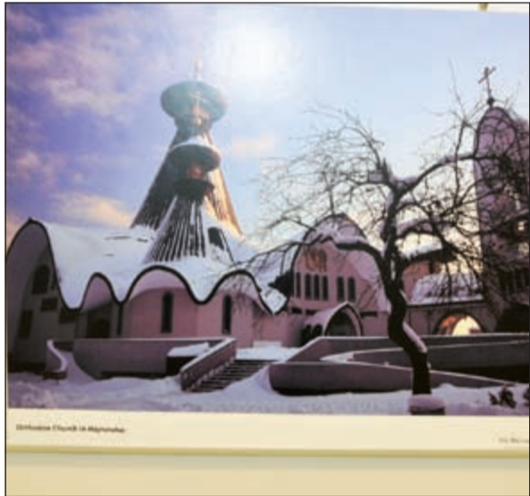
..وأخرى تدل على التسامح الديني بين الشعوب