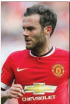
هل يعود ماتا لناديه السابق؟