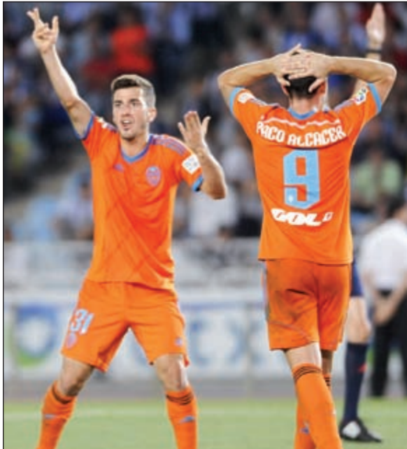
فالنسيا سقط أمام سوسبيداد