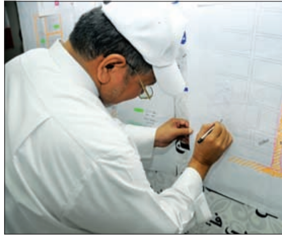
اعتماد توزيع الأراضي المخصصة لبعثة الحج