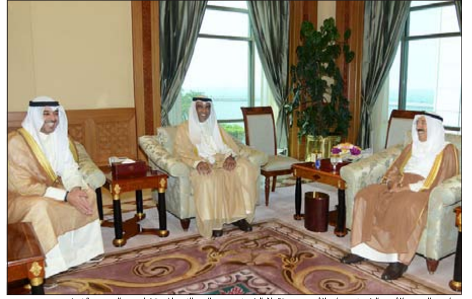
صاحب السمو الأمير الشيخ صباح الأحمد مستقبلاً الشيخ محمد العبدالله والمستشار عبدالرحمن النمشن

ما أبداه فخامته من إشادة بالدور الإنساني الذي تقوم به الكويت في مجال الإغاثة والعمل الإنساني ومقدرا سموه بمبادراته الكريمة المجسدة للعلاقات الطيبة التي تجمع البلدين والشعبين الصديقين، متمنياً سموه لفخامته موفور الصحة والعافية وللبلد الصديق المزيد من الرقي والازدهار.