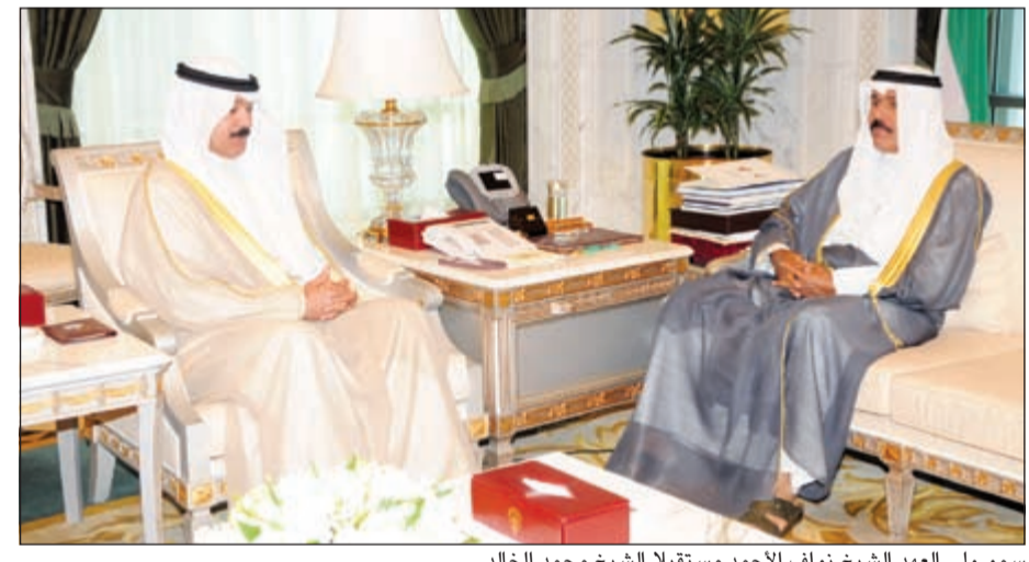
سمو ولي العهد الشيخ نواف الأحمد مستقبلاً الشيخ محمد الخالد

استقبل سمو ولي العهد الشيخ نواف الأحمد في ديوانه بقصر السيف صباح أمس رئيس مجلس الأمة مزروق الغانم. واستقبل سموه، بقصر السيف صباح أمس رئيس مجلس الوزراء بالإنابة ووزير الداخلية ووزير الدفاع بالإنابة الشيخ محمد الخالد. كما استقبل سموه وزير الإعلام ووزير الدولة لشؤون الشباب الشيخ سلمان الحمود. واستقبل سموه وزير الدولة لشؤون مجلس الوزراء ووزير العدل بالوكالة ووزير الخارجية بالإنابة الشيخ محمد العبدالله.