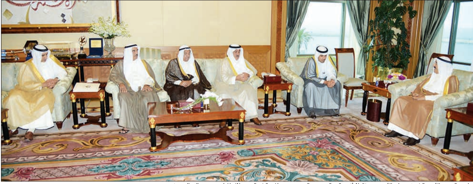
صاحب السمو الأمير الشيخ صباح الأحمد مستقبلاً أنس الصالح ويدر السعد ومصطفى الشمالي وهلال المطيري وعبدالله الحميضي

الأمير استقبل ولي العهد والغانم والخالد والعبدالله والنمشن والصالح وأعضاء مجلس إدارة هيئة الاستثمار