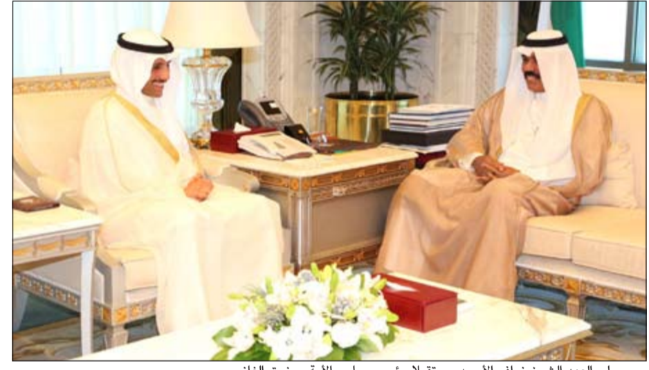
سمو ولي العهد الشيخ نواف الأحمد مستقبلاً رئيس مجلس الأمة مرزوق الغانم