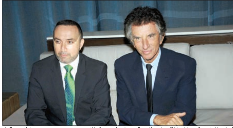
السفير الفرنسي كريستيان نخلة ورئيس المعهد العربي في باريس جاك لانج (ماني عبدالله)

كشف رئيس معهد العالم العربي في باريس ووزير الثقافة الفرنسي الأسبق جاك لانج، عن رسالة يحملها لصاحب السمو الأمير الشيخ صباح الأحمد من الرئيس الفرنسي فرانسوا هولاند، ولكنه لم يفصح عن مضمون هذه الرسالة، مبيّناً أنه يزور الكويت لتقديم التهنيئة لصاحب السمو لتكريمه قائداً إنسانياً في الأمم المتحدة، فضلاً عن إجراء محادثات مع الحكومة الكويتية حول المشاريع الثقافية المشتركة.