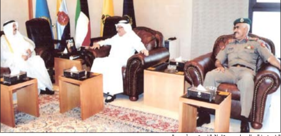
الشيخ خالد الجراح مستقبلاً الفريق م. أحمد الرجيب

قام محافظ مبارك الكبير الفريق أول م. أحمد الرجيب بزيارة نائب رئيس مجلس الوزراء ووزير الدفاع الشيخ خالد الجراح ورئيس الأركان العامة للجيش، حيث تم تبادل الأحاديث