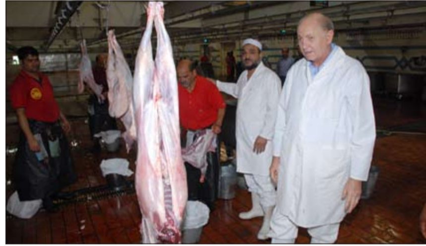
المسليخ ستعمل بكامل طاقته في العيد

وحذرت إدارة العلاقات العامة للمواطنين والمقيمين من التعامل مع القصابين الجائلين حرصاً على سلامةهم ودينتهم إلى عدم التردد بالاتصال على الخط الساخن 139 الذي يعمل على مدار الـ 24 ساعة وخلال العطلة الرسمية في حال وجود أي شكوى.