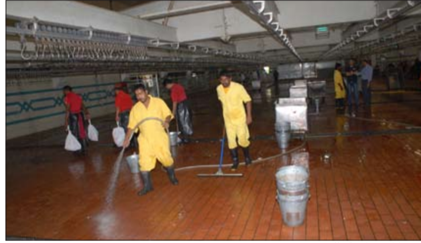
استعدادات في المسالخ للعيد

ان طريقة الذبح تتم ضمن آلية منظمة من حيث طريقة الذبح وآلية النظافة بعد الذبح وفحصها من الأطباء البيطريين المختصين وإتلافها في حال كون الذبيحة غير صالحة للاستهلاك الأدمي وفي حال كون الذبيحة صالحة للاستهلاك يتم تقطيعها حسب رغبة الزبون، هذا في الأيام العادية أما في أيام الأعياد فيتم تقطيعها إلى 4 قطع كحد أقصى نظراً لكثرة أعداد الذبائح التي تصل إلى 10 أضعاف الأيام العادية.