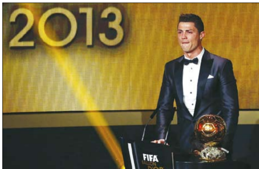
كريستيانو رونالدو يسعى إلى الاحتفاظ بجائزة أفضل لاعب في العالم

وقبلها سيتم الاعلان عن التصفية النهائية بين ثلاثة لاعبين في الاول من ديسمبر 2014 بخلاف ترشيحات أفضل مدرب وأفضل هدف وأفضل لاعبة. يذكر أن النجم البرتغالي كريستيانو رونالدو هداف فريق ريال مدريد الإسباني فاز بالكرة الذهبية العام الماضي للمرة الثانية في مسيرته.