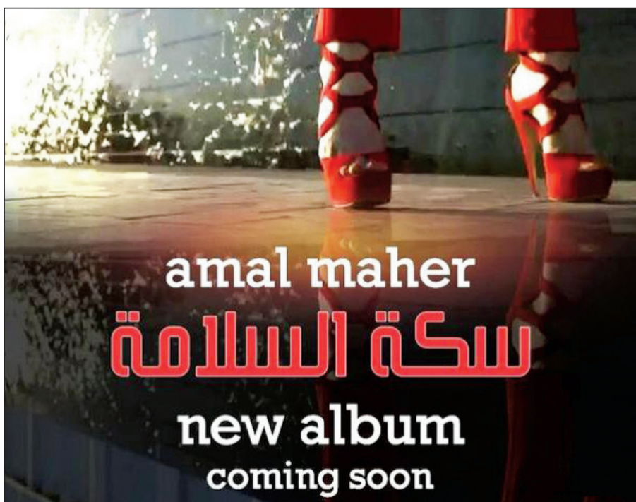
بوستر اليوم آمال ماهر سكة السلامة.

بعد انتهائها من تفاصيل ألبومها الجديد، بدأت الفنانة آمال ماهر الحملة الدعائية للألبوم المنتظر مع شركة «مزىكا» عبر صفحاتها على مواقع التواصل الاجتماعي. وبينما كتبت ماهر عبر «تويتر» أن ألبومها سيحمل اسم «سكة السلامة» وهي إحدى الأغنيات الموجودة بداخله، نشرت صورة دعائية للألبوم تظهر فيها قدميها بحذاء أحمر