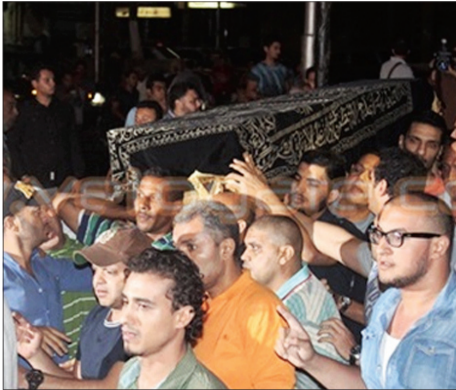
جانبا من تشجيع جثمان خالد صالح