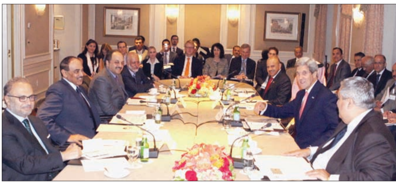
الشيخ صباح الخالد وجون كيري خلال الاجتماع الوزاري المشترك

ترأس اجتماع وزراء خارجية دول التعاون مع كيري وروسيا