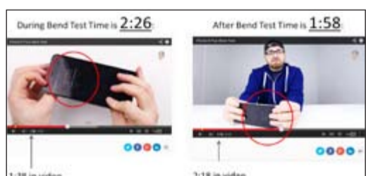
تحليل تقني لخيدوير الانحناء بالضغط عبر اليدين

23 مليار دولار خسائر «أبل».. بعد مشاكل «آيفون 6»