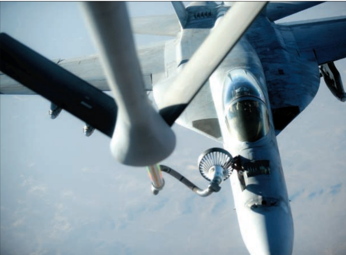
صورة وزعتها القوات الاميركية لطائرة اف 18 خلال تزودها بالوقود في الجو بعد قيامها بغارة في سورية

متطرفة، وقال مخاطبا نظيره الفرنسي «نحن معكم ومع الشعب الفرنسي في وقت تواجه فيه خسارة رهيبه وتفوقن ضد الرعب دفاعا عن الحرية». وتبنى مجلس الامن ايضا بياناً «دان فيه بشدة عملية القتل الشنيعة والجبانة لايرفيه غورديل». وذكر اوباما بتأكيد الخبراء ان نحو 15 الف مقاتل اجنبي وفدوا من اكثر من ثمانين بلدا انضموا في الاعوام الاخيرة الى التنظيمات المتطرفة في العراق وسورية. وقال الرئيس اميريكي ان اصدار «قرار لن يكون كافيا والنوايا الطيبة ليست كافية، ينبغي ان يقترن الكلام الذي يقال هنا بأفعال ملموسة في الاعوام المقبلة». من ناحيته، اعتبر هولاند ان «هذا القرار هو رسالة حزم ووحدة من الاسرة الدولية بأسرها»، وقال ان «الرد على تنظيم الدولة الاسلامية هو عسكري ولكنه ايضا اقتصادي وانساني»، مشيراً الى ضرورة تجفيف الموارد المالية للارهاب. اما ديفيد كامبرون فذكر ان 500 بريطاني هم من بين الجهاديين الاجانب وان العنصر في الدولة الاسلامية الذي قطع رأس صحافيين اميركيين امام الكاميرا كان يتحدث بلهجة بريطانية. وشدد على تعزيز المراقبة وكذلك على التصدي