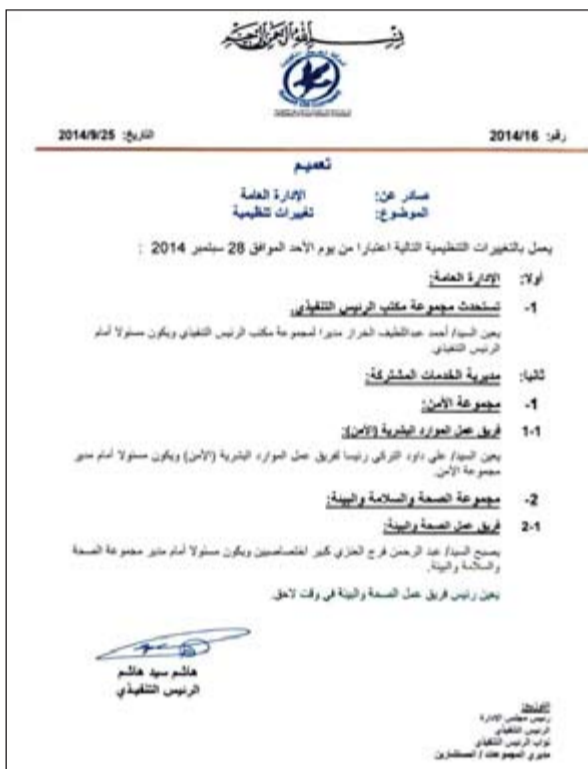
صورة من تعميم نفط الكويت الذي صدر أمس