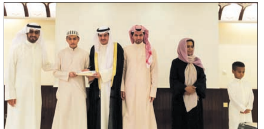
تكريم أحد الفائزين

المسابقة وانجازها، متقدمة بخالص الشكر والثناء للقيادة السياسية دعمها المستمر لأنشطة وأعمال الجمعية. من جانبه، قال وكيل وزارة الأوقاف والمشاريع الدينية الكريمة والدراسات الاسلامية عبد الله براك ان استمرار المسابقة والتعاون المثمر بين الوزارة والجمعية الكويتية للأسرة المثالية للسنة التاسعة على التوالي دليل واضح على النجاح الذي حظيت به هذه الشراكة. وأضاف ان التعاون المتواصل بين الجهتين يشير الى يؤكد عسق الثقة بين الطرفين وهو امر ليس بغريب على أسرة آل الصباح الكرام والتي تمثلها رئيسة الجمعية في هذا الحدث وعلى اهتمام