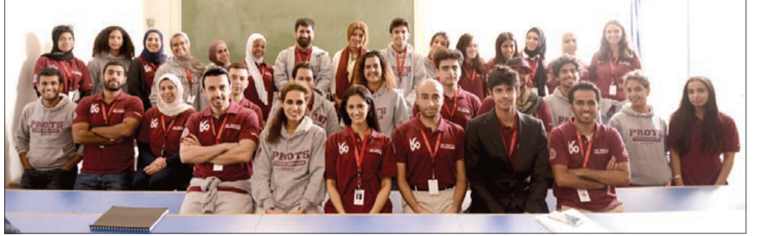
لقطة تذكارية للمشاركين والمشاركات ببرنامج البروتيجيز في دبلن

في يوم واحد، وتم قضاء بقية الرحلة في «غالواي»، أيرلندا. هذا وكانت أيام التدريب حافلة بأنواع مختلفة من ورش العمل والمحاضرات والأنشطة والوان المعرفة المختلفة التي يقودها مجموعة من المرشدين المؤهلين تأهيلاً عالياً.