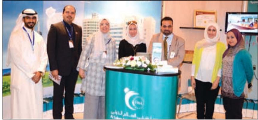
لقطة تذكارية مع عدد من المشاركين بالمؤتمر